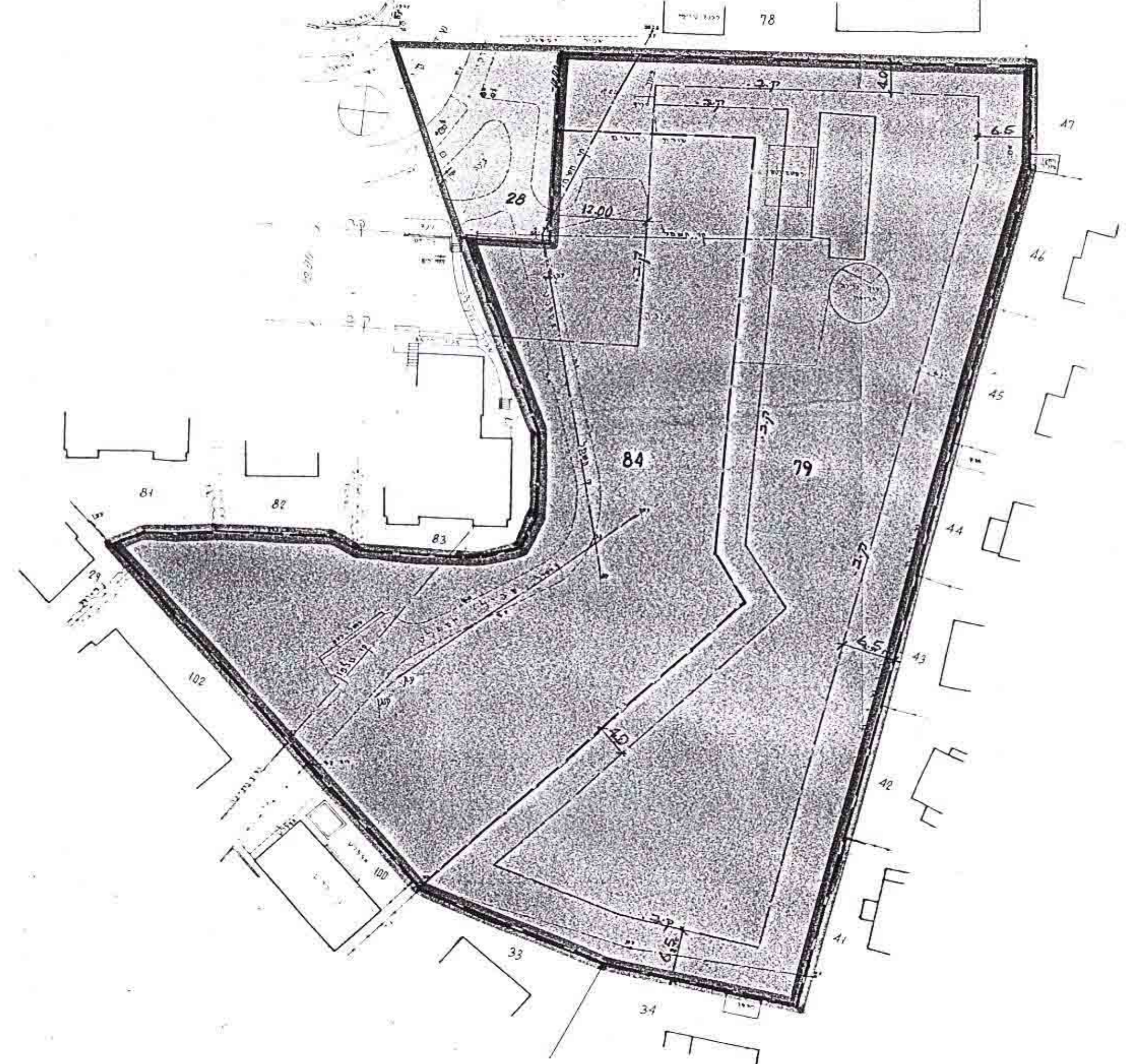
מצב מחושר קל"מ 1:500