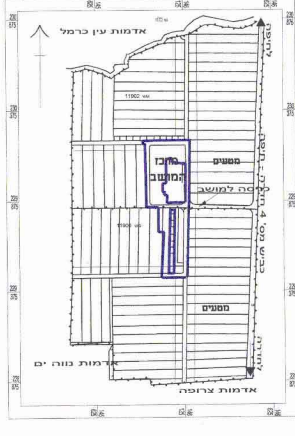
תרשים סביבה 1:12,500 חתימות

אשר על-פי תכנית מס' 23 מורטטה ב' ליקוט הפרסומים מס' 4524 מיום 22.5.97 הועדה המקומית לבניה ותכנון עיר חוף הכרמל החליטה להאשר את תכנית מס' 23 הועדה המחוזית לתכנון ולבניה החליטה ביום 17.11.95 לאשר את התכנית מנהל המחוז הועדה המקומית לבניה ותכנון עיר חוף הכרמל החליטה להאשר את תכנית מס' 23 הועדה המחוזית לתכנון ולבניה החליטה ביום 4.7.97 לאשר את התכנית מנהל המחוז