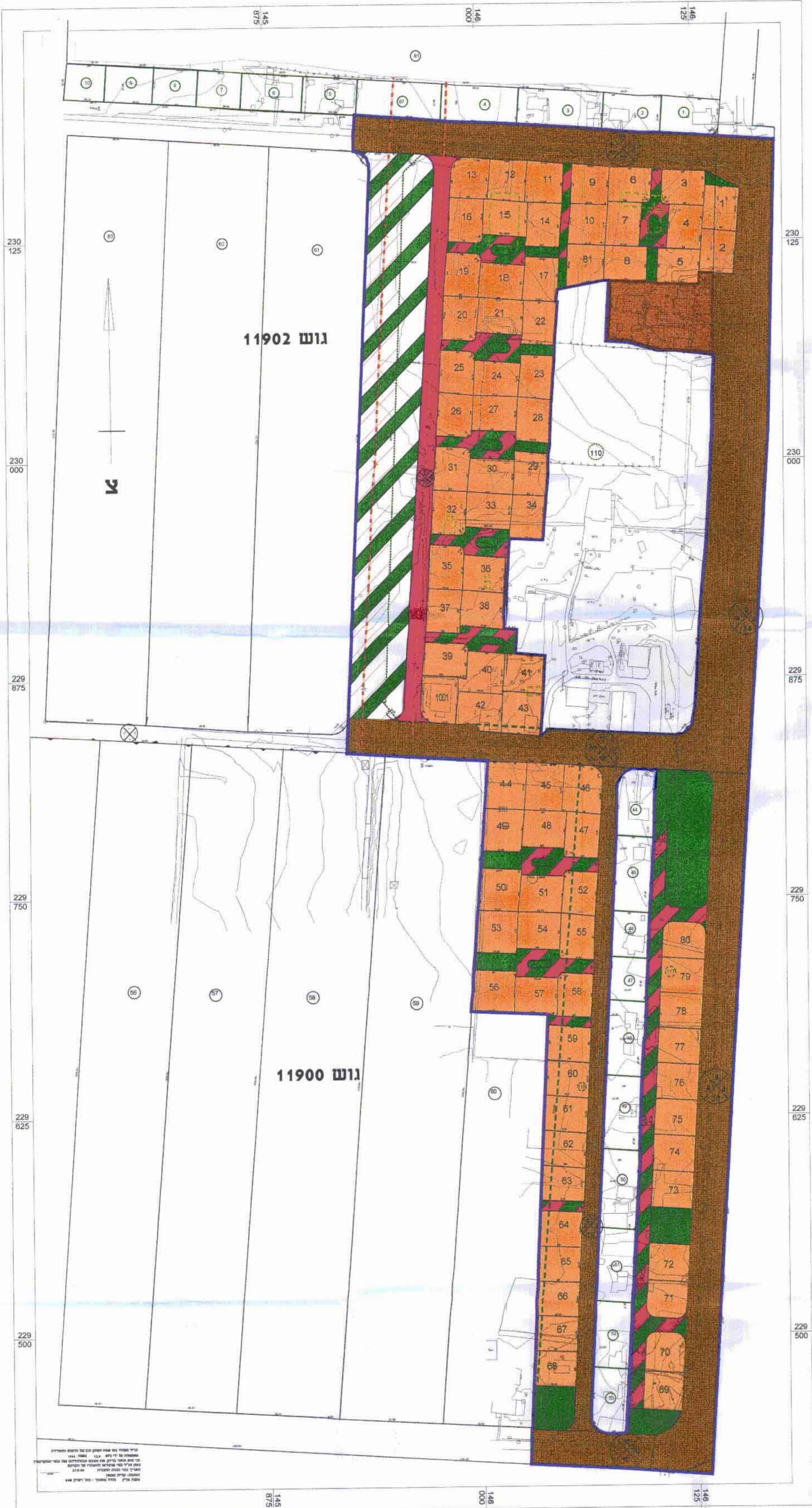
מצב מוצע 1:1,250