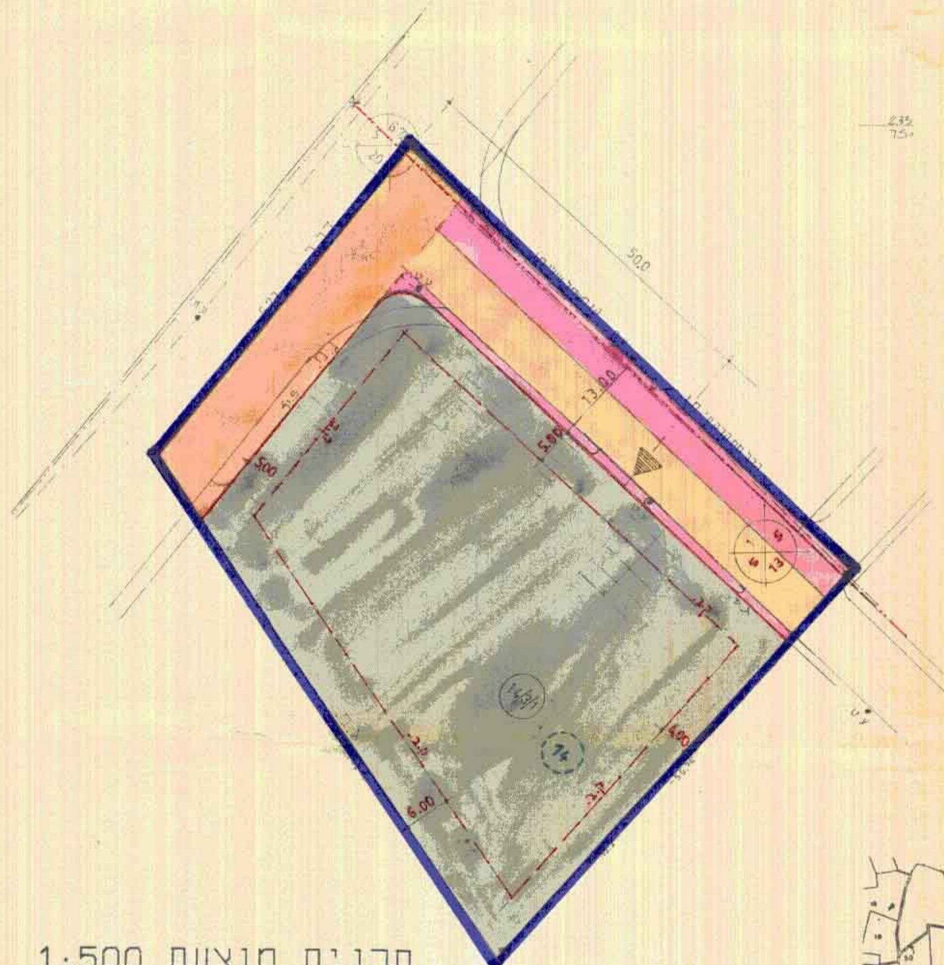
תכנית מוצעת 1:500