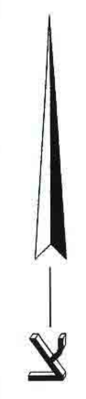
תרשים סביבה 1 : 10,000