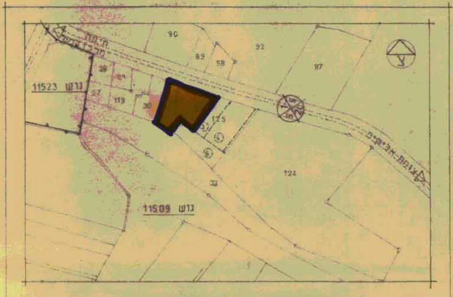
קטע תכנית לשינוי ק.מ. 1:2500