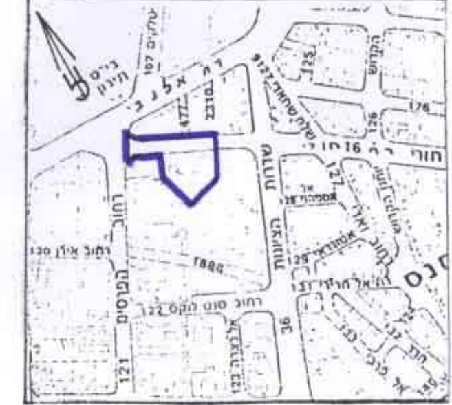
תרשים סביבה קני"מ 1:5000

מנהל מקרקעי ישראל עיריית חיפה תאריך: 28/1/99