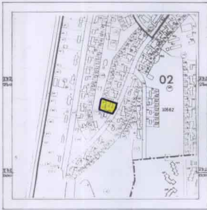
תרשים הסביבה - 1:5000