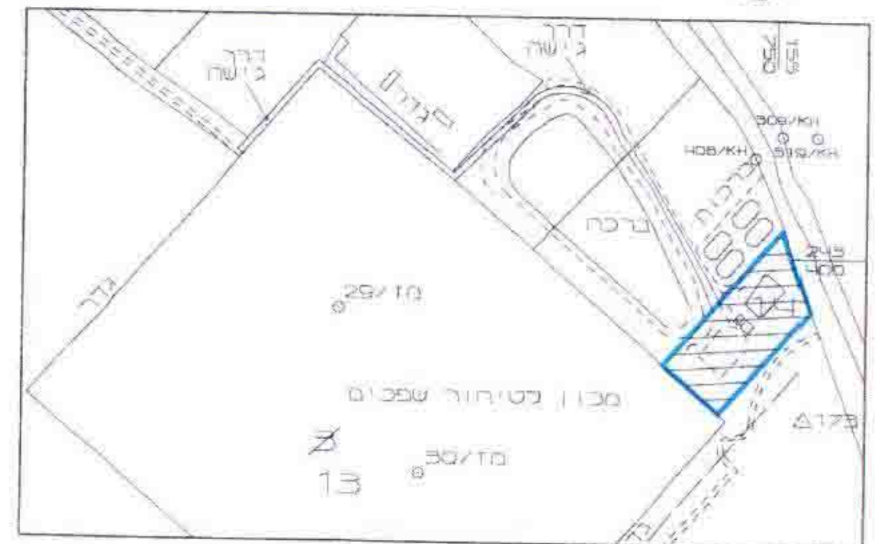
חרשיים סביבה ק.מ. 1:5,000