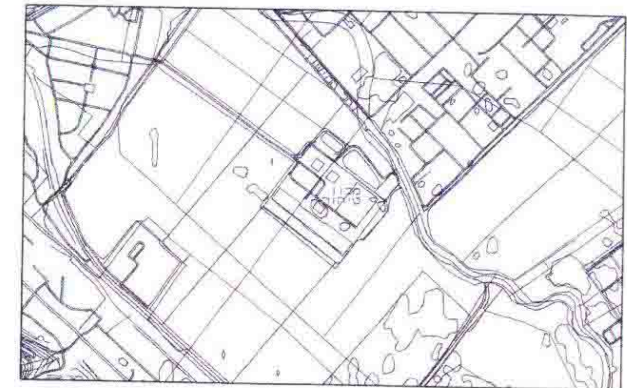
חרשיים סביבה ק.מ. 1:20,000