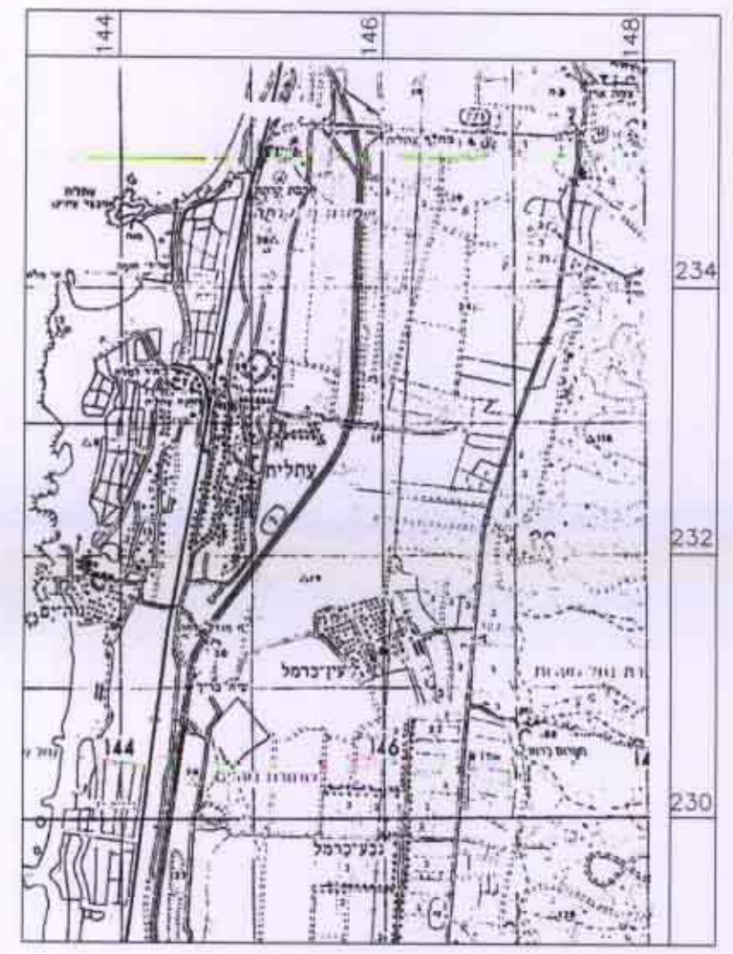
תרשים סביבה קנ"מ 1:50000

עורך התכנית - אלה טרכמנברג ת.ד. 284, נשר 36602, טל' 04-8202605 שטח התכנית - 24.20 דונם מדוד גרפית קנ"מ 1:1000