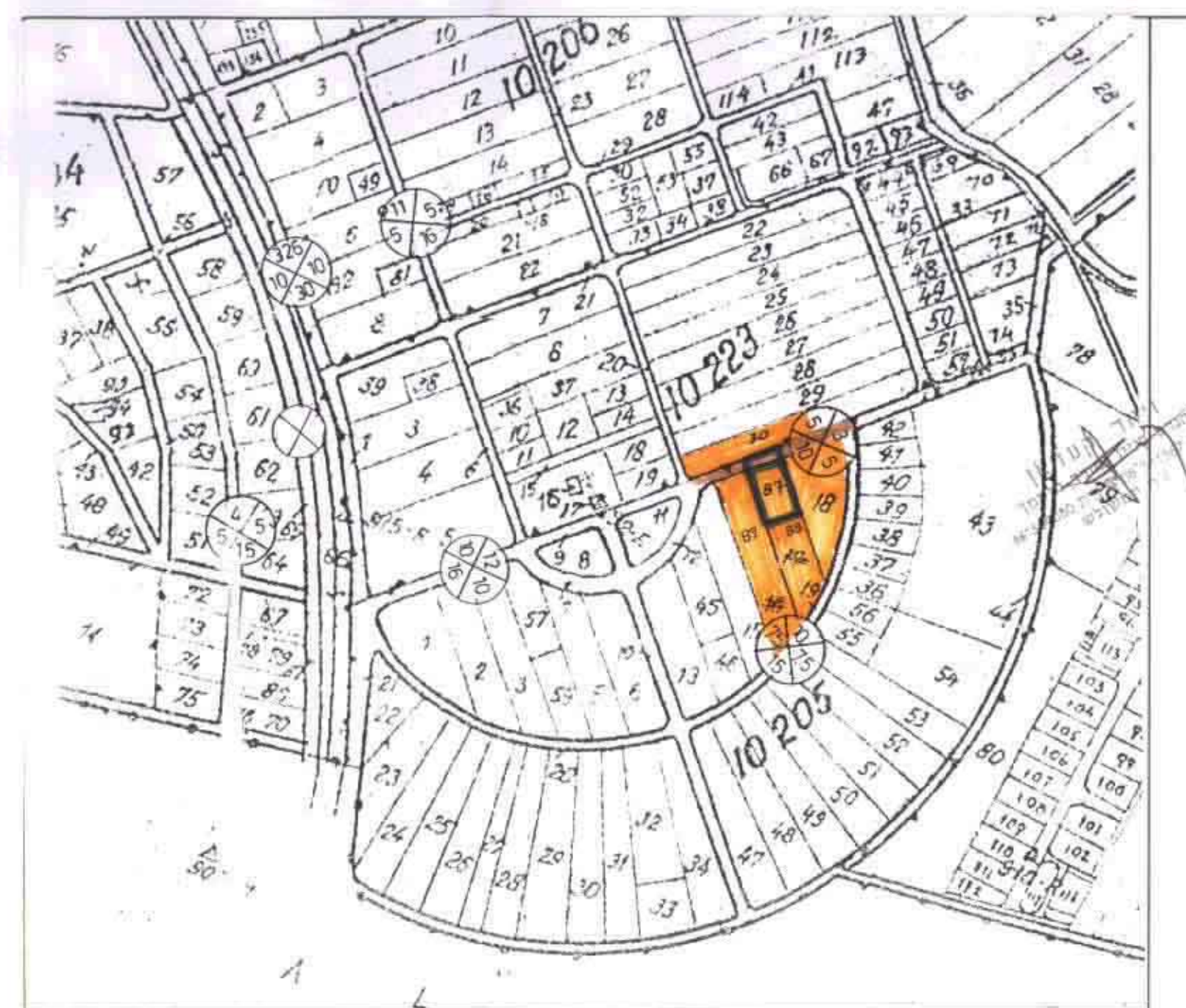
תרשים סביבה לפי ש/23/א קט"מ 5000 : 1