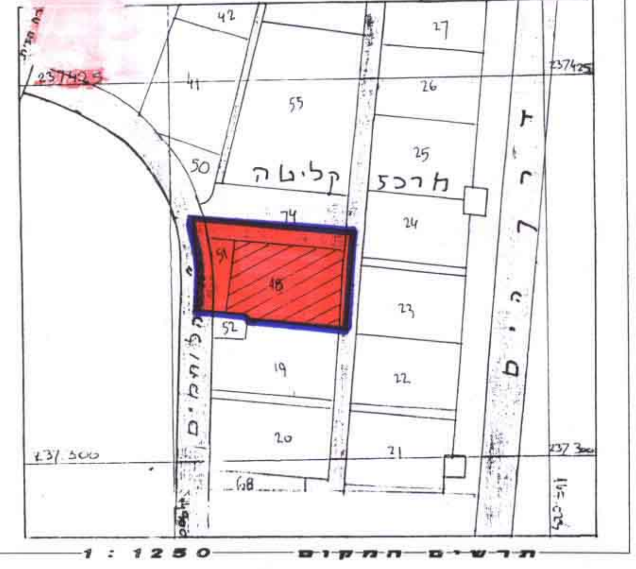
מראה המקום 1:1250