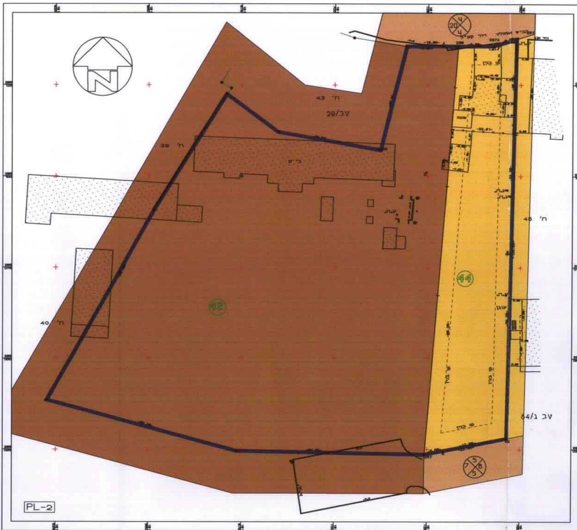
תכנית מאושרת ק"מ 1:500