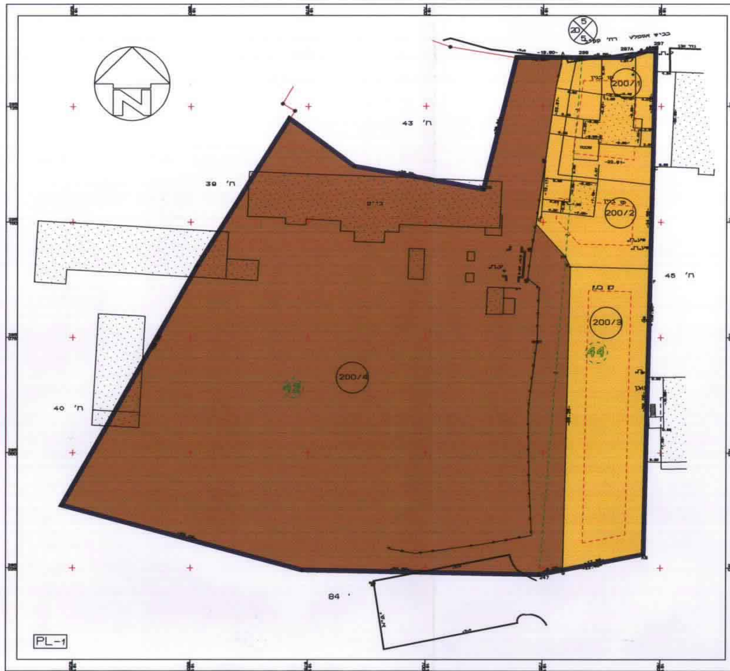
תכנית מוצעת ק"מ 1:500