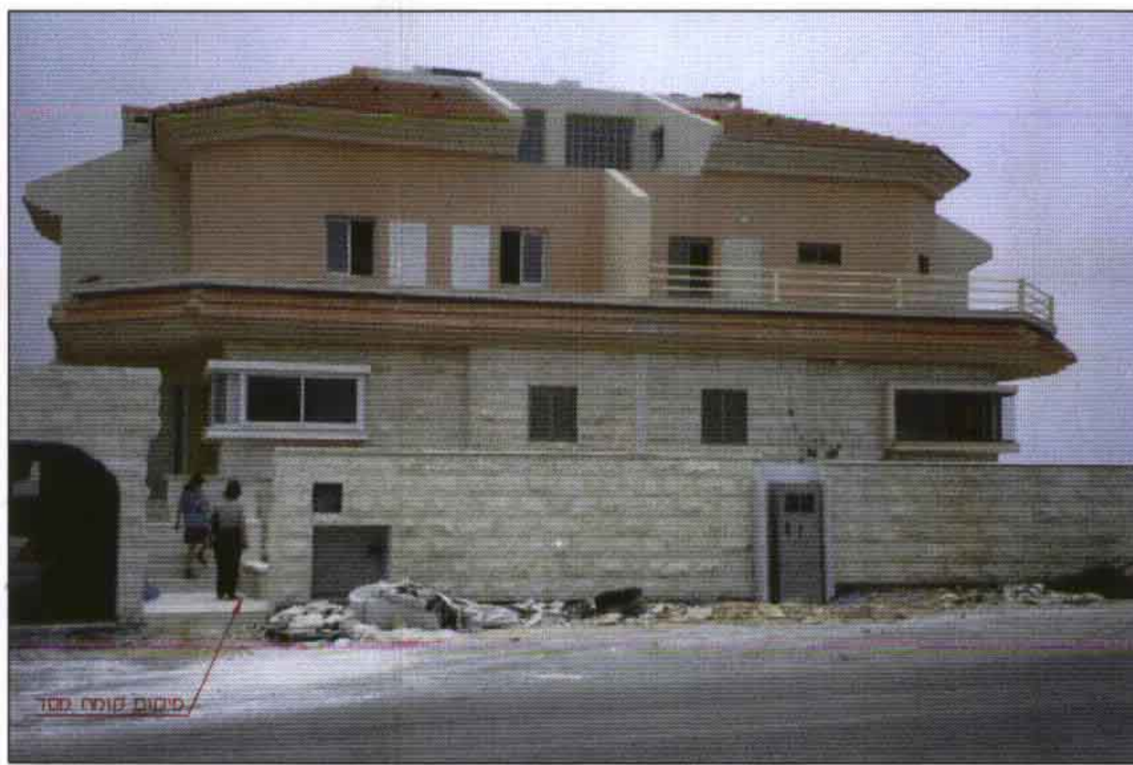
מבט על הבית