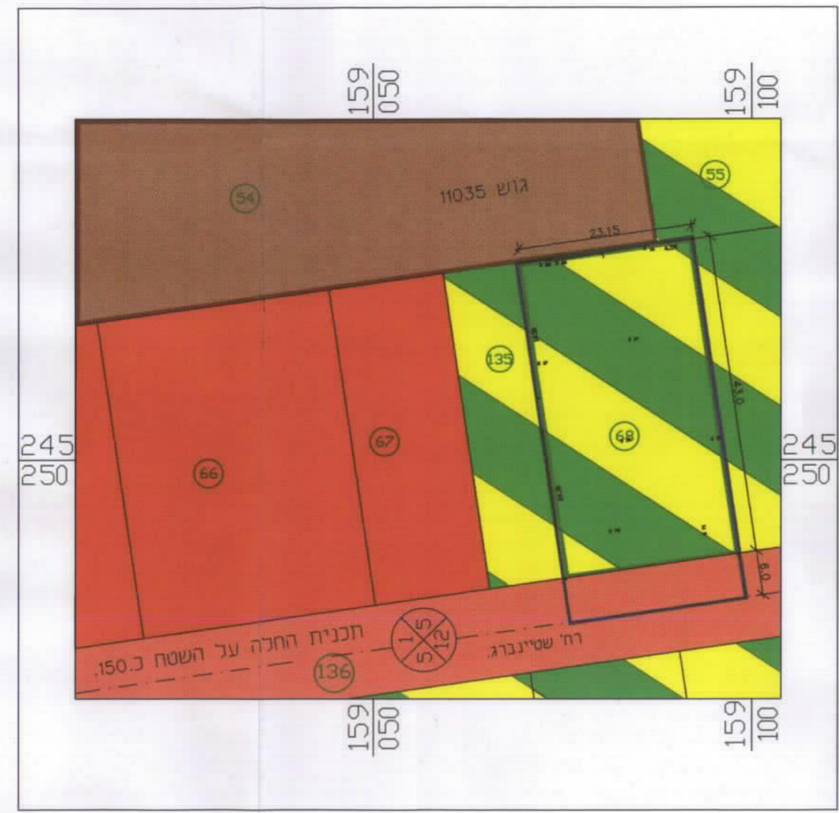
מצב קיים 1:500

איחב סוהיל חביב מודד מוסמך מס' ר 726 מס' 1530 מס' 726 מס' 17 מס' 8531497 מס' 8531726