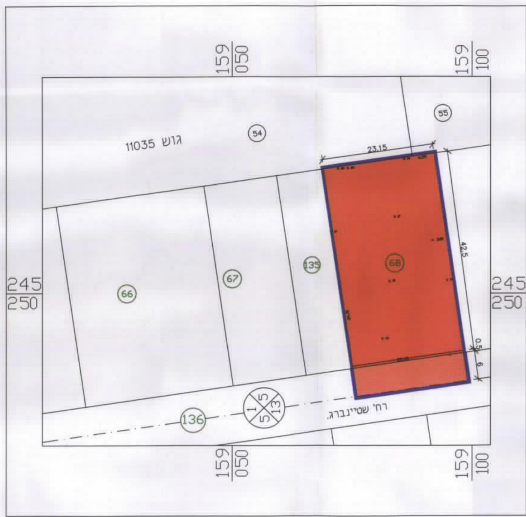
מצב מוצע 1:500