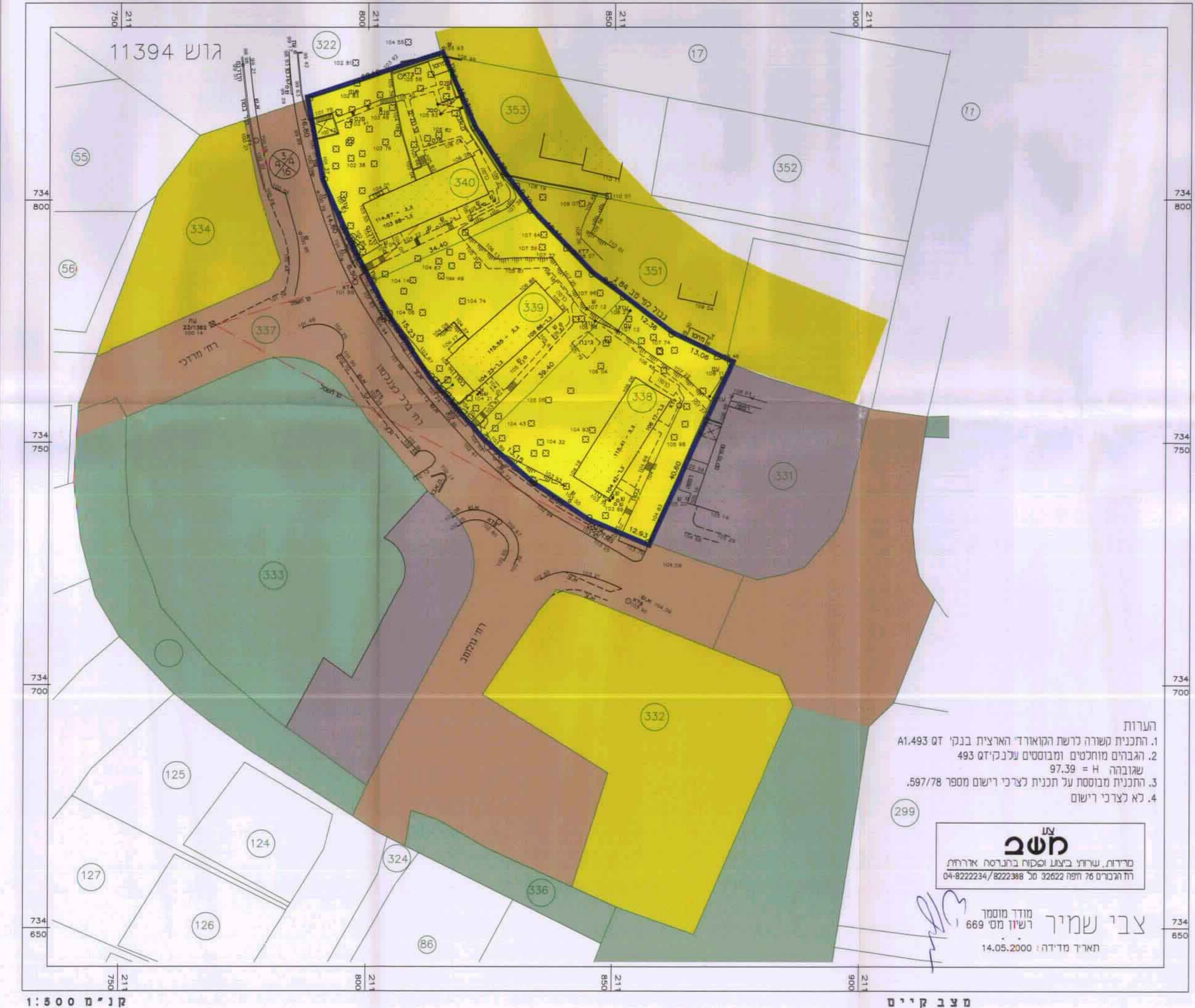
מַצַב מוֹצֵע 1:500 קו"מ

הערות 1. תוכנית משורה כגשת המוארך הארצית. בגני 41.493 א' 2. הגברים מוחלטים ומבוססים על גני 493 3. שגובה H = 97.39 4. תוכנית מבוססת על תכנית לצרכי רישום מספר 597/78. לא לצרכי רישום