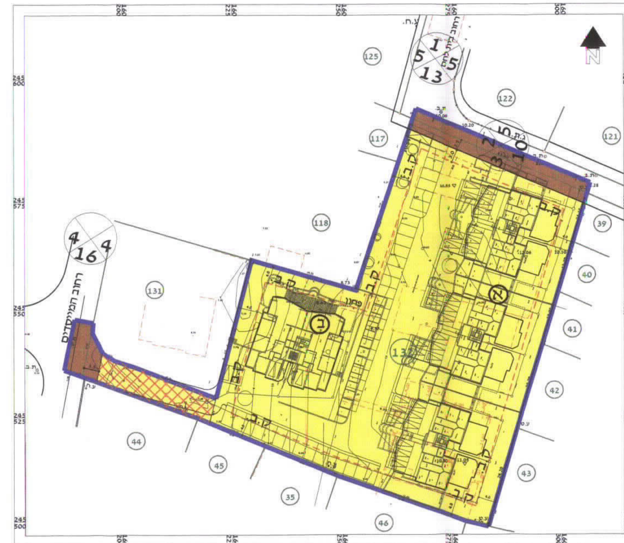
מצב מוצע קני"מ 1:500