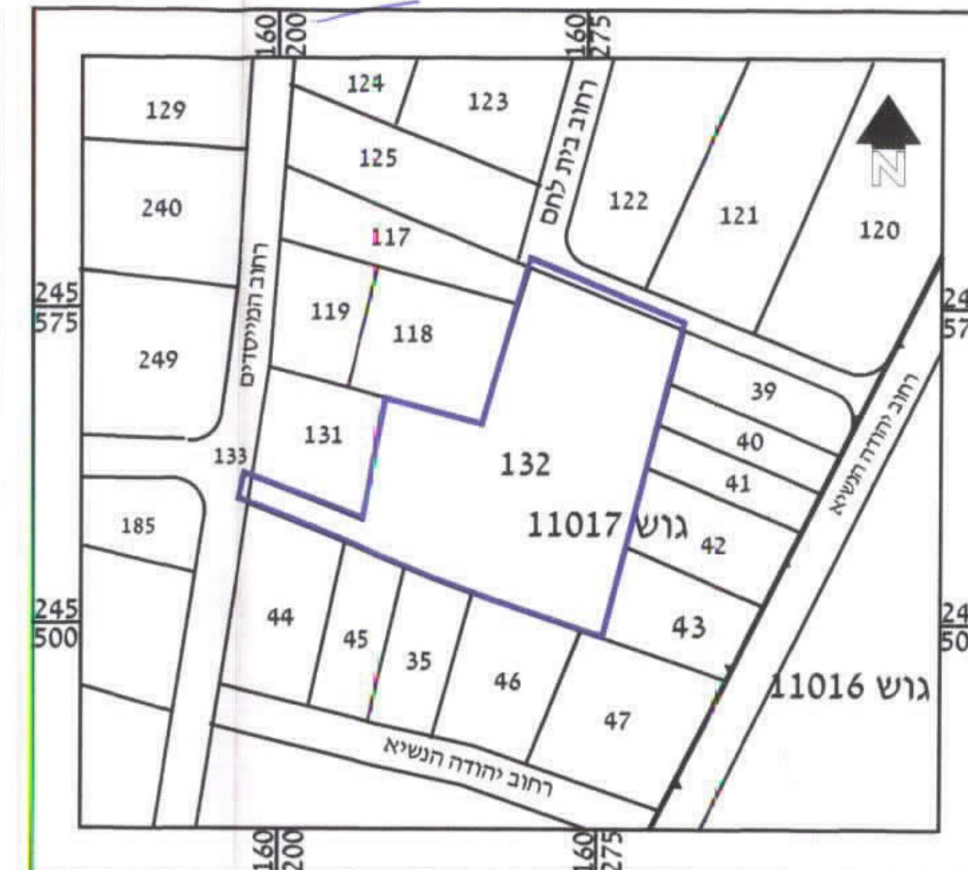
תרשים סביבה קני"מ 1:1250