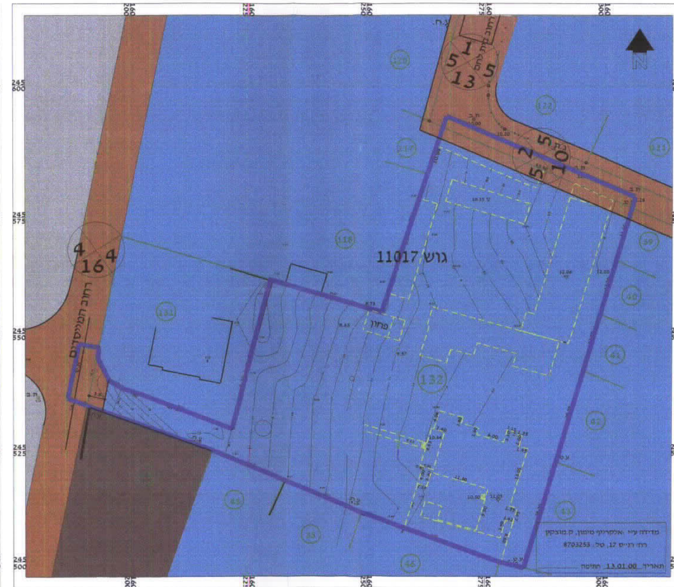
מצב קיים קני"מ 1:500