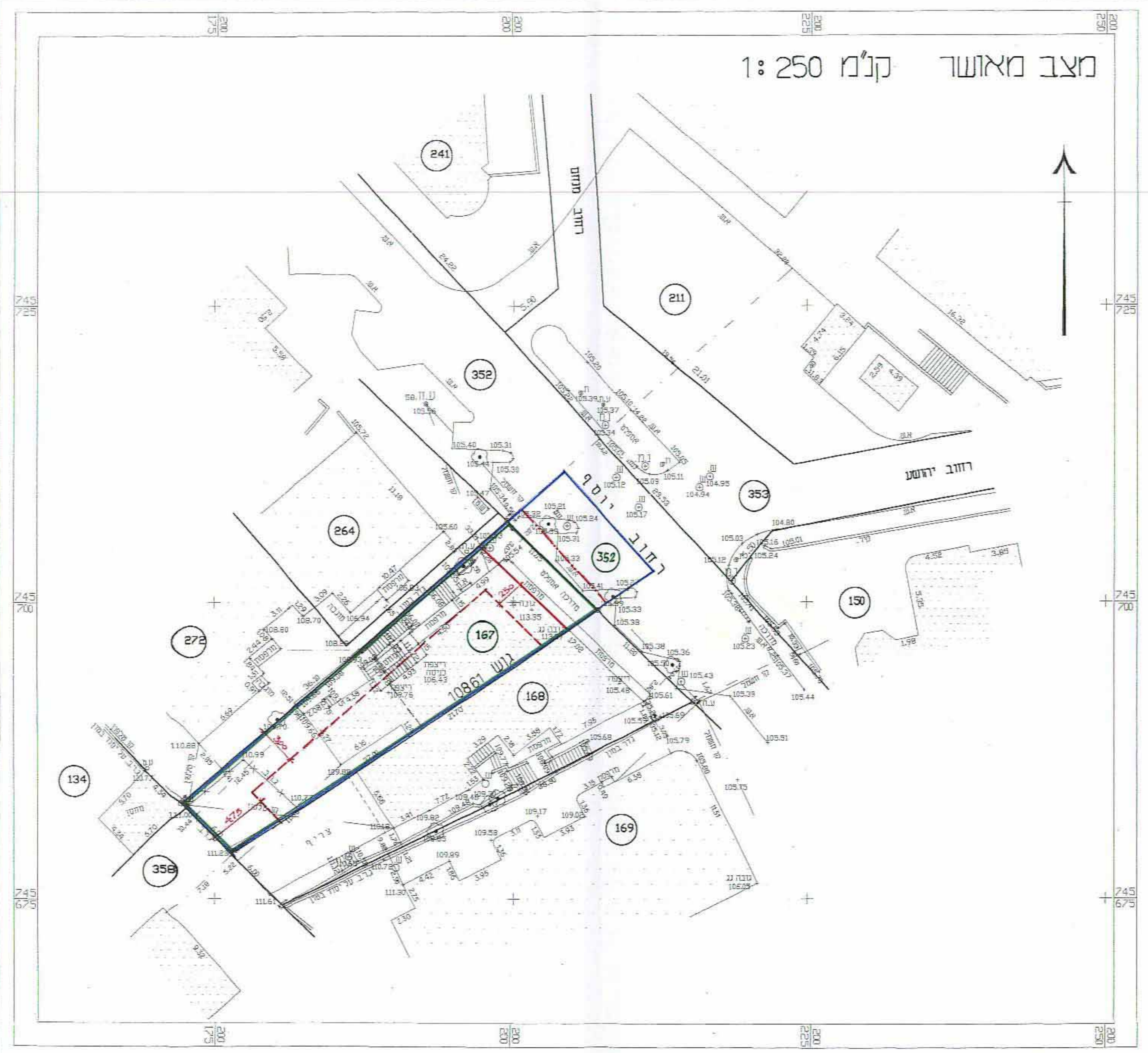
מצב מאושר קנ"מ 1:250