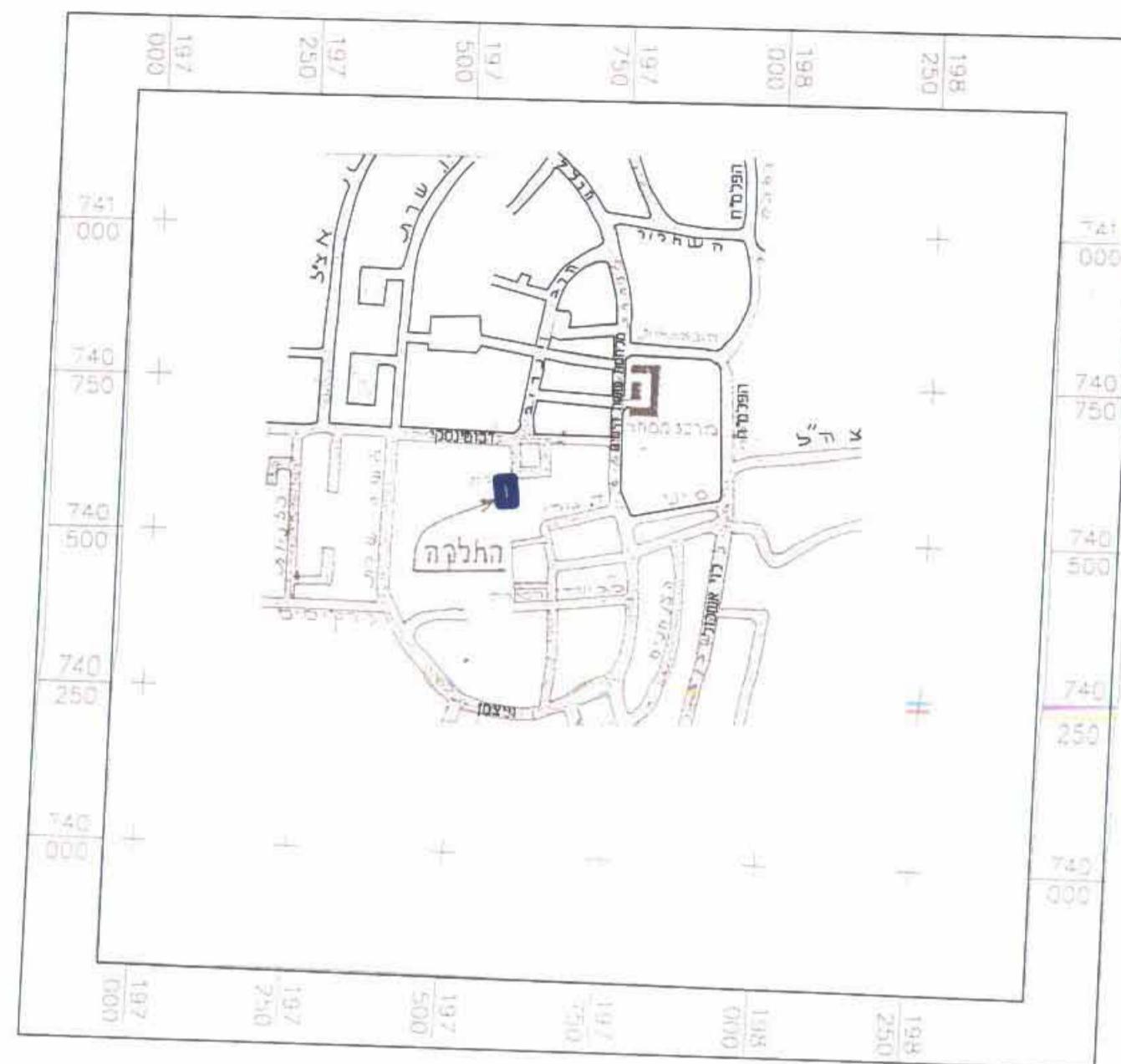
תרשים התמצאות כללית קנ"מ 1:10,000