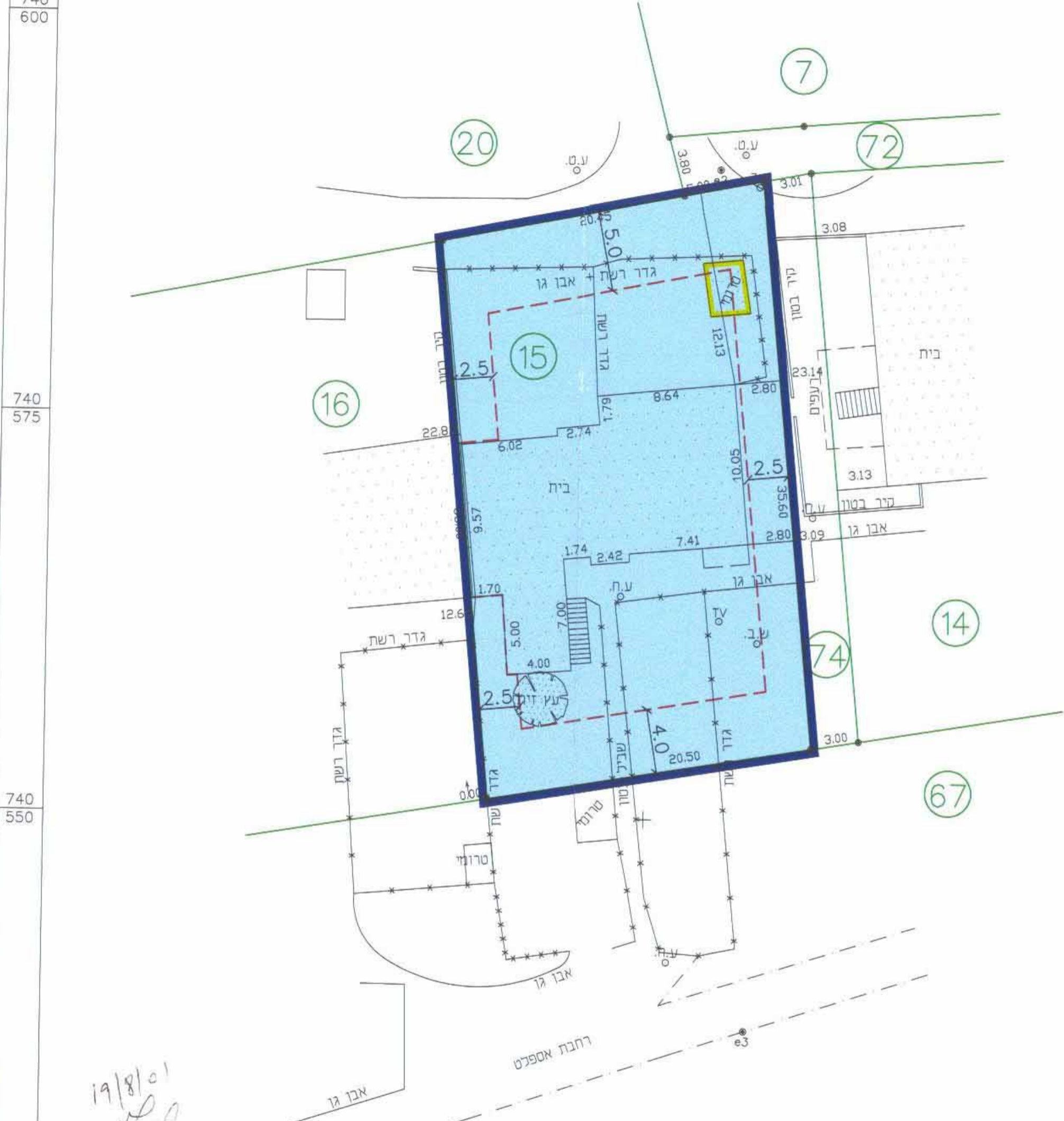
מצב מוצע קנ"מ 1:250

19/8/01 חורי אייאס מהנדס ומודד מוסמך מ-773 / 52039