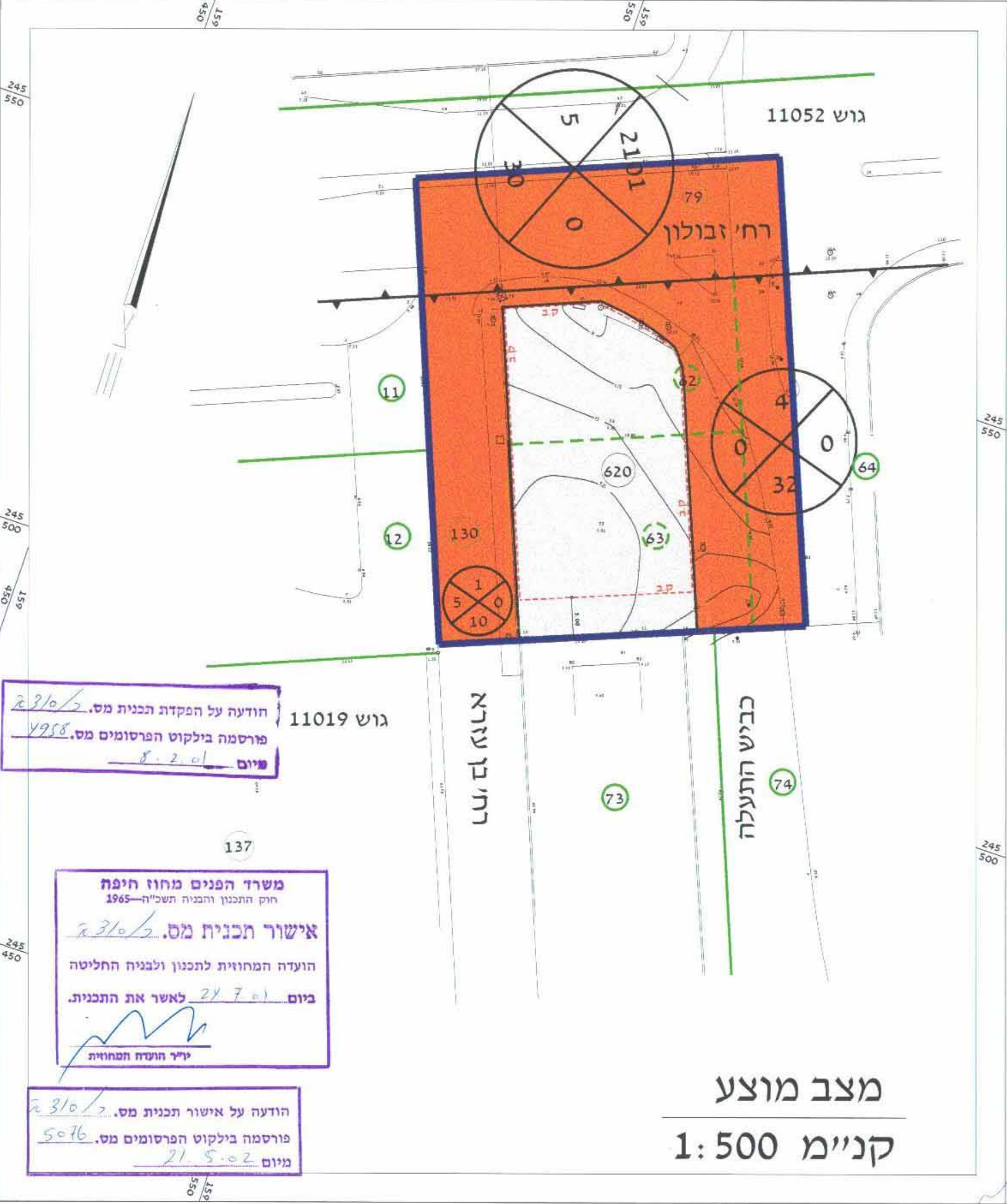
מצב מוצע קני"מ 1: 500

אלקטרי רח' רנ"ס 17 טל. 751244 6-2-02 מידע עיני: מיפון אל קרוין, כודד מוסטן, מס' רשיון 383 רח' רנ"ס 17, ס.פונטין, טל. 8761244 ח"ח 16.06.2000 תאריך