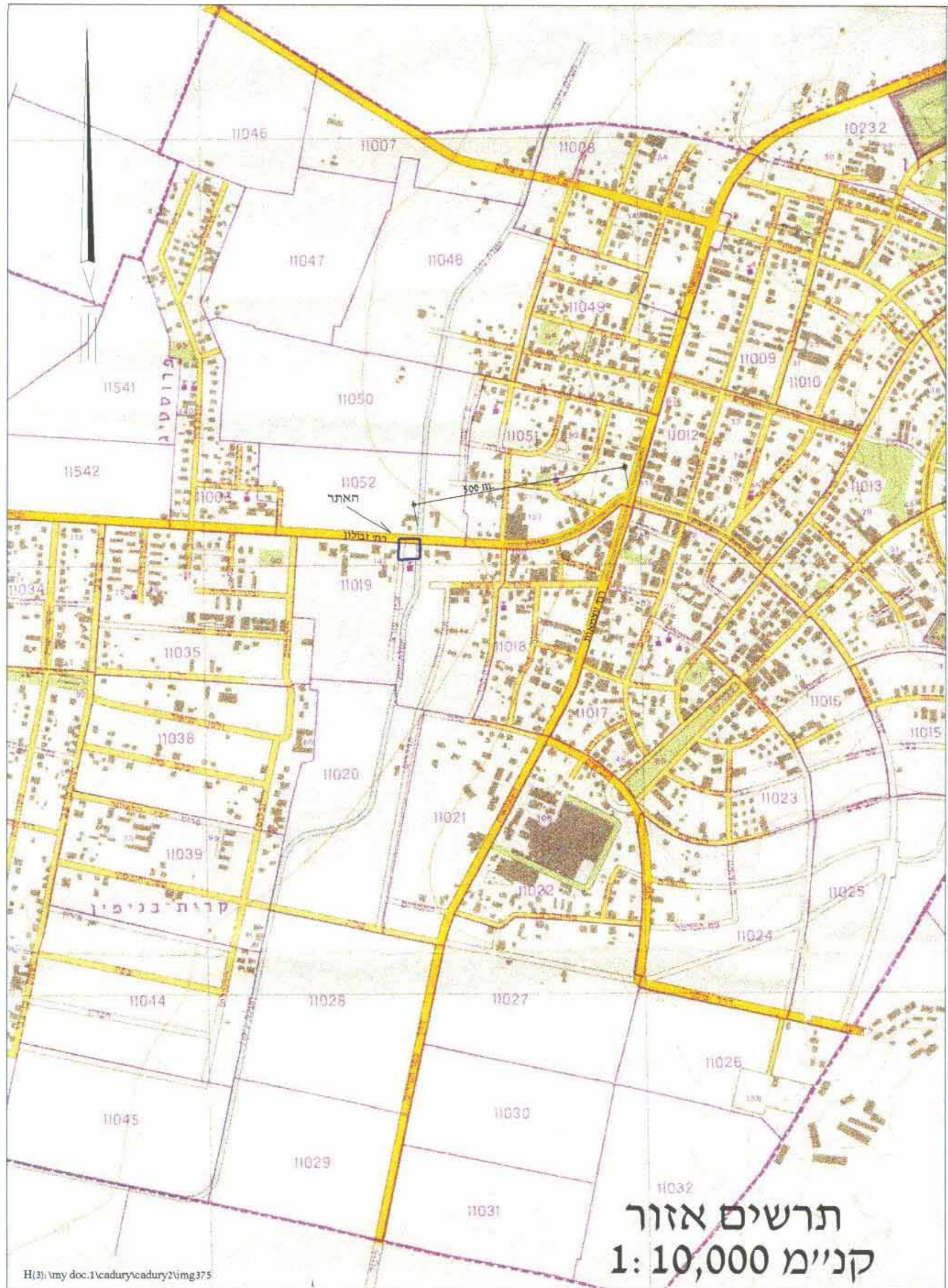
תרשים אזור קני"מ 1: 10,000

חתימות איתמר מאור אדרי' 32207 אינטרנציונל טל. 05-8235291