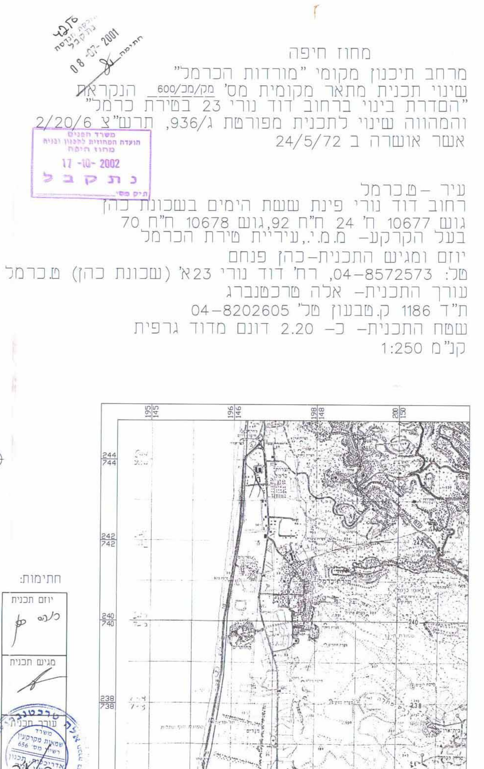
תרשים סביבה קנ"מ 1:50000