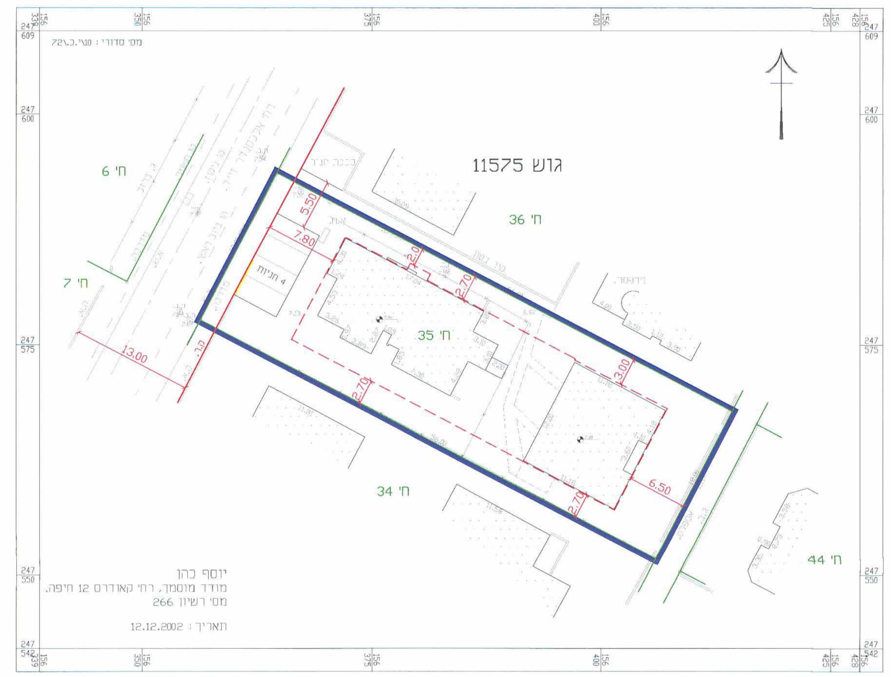
מצב מוצע קט"מ : 1:250

יוסף כהן מודד מוסמך, רח' קאמח 12 חיפה, מס' רישום 266 תאריך : 12.12.2002