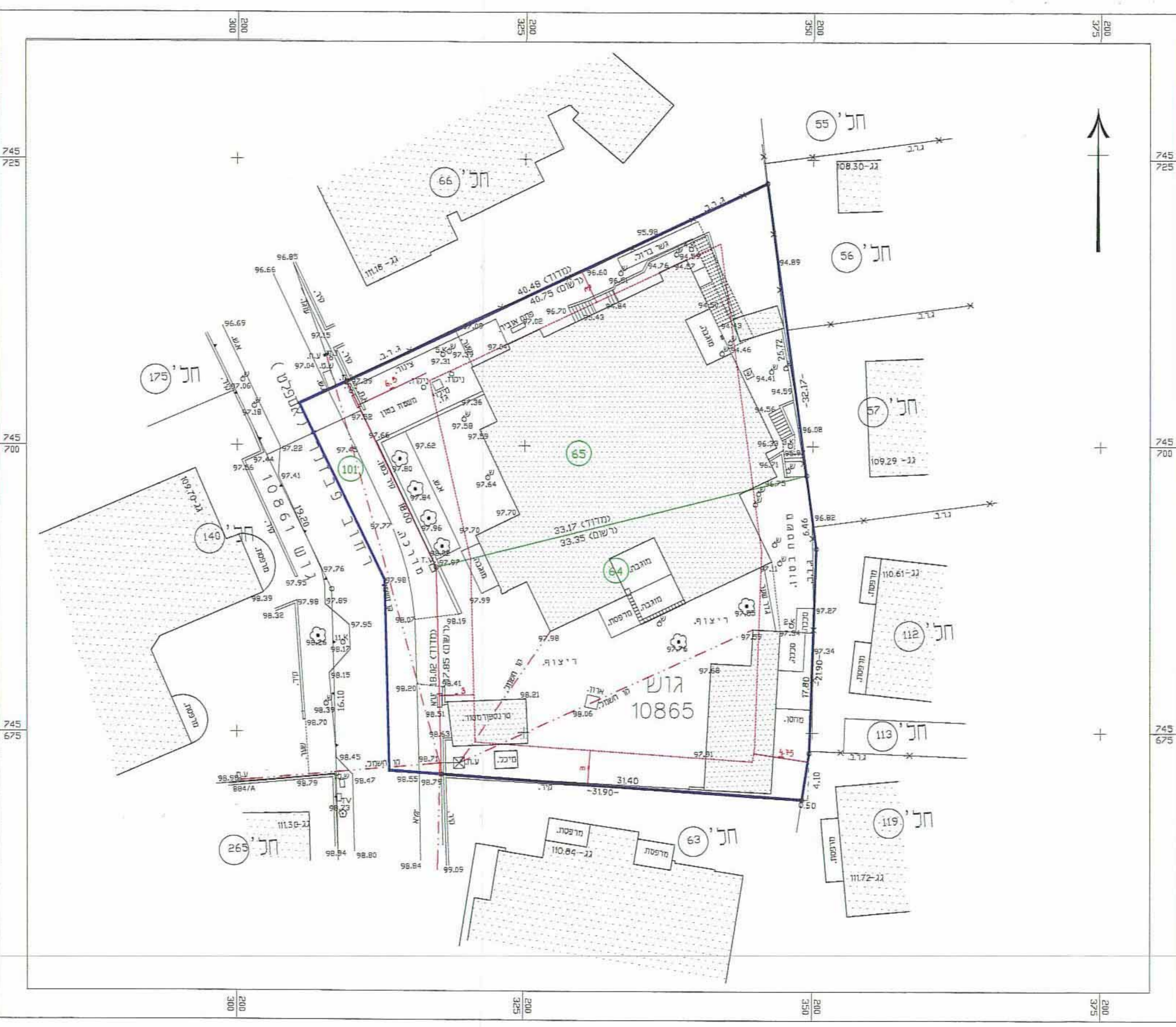
מצב מאושר 1:250