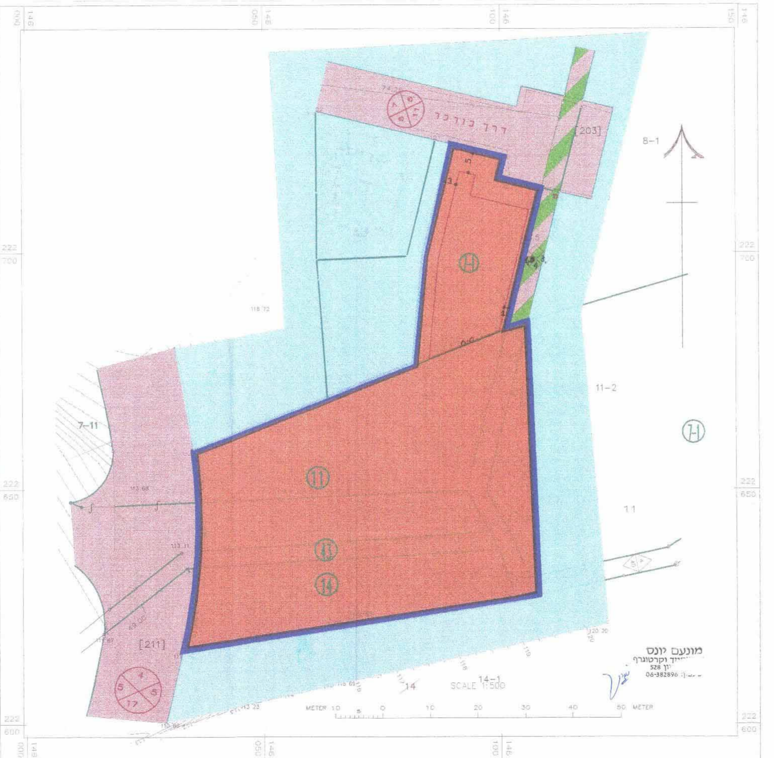
תכנית מצב מוצע קנ"מ 1:500