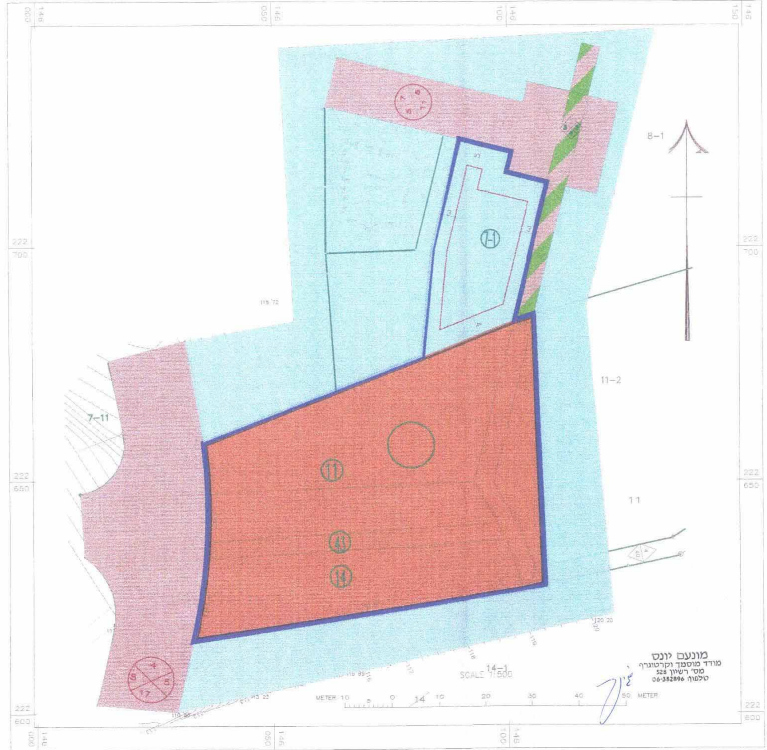
תכנית מצב קיים קנ"מ 1:500