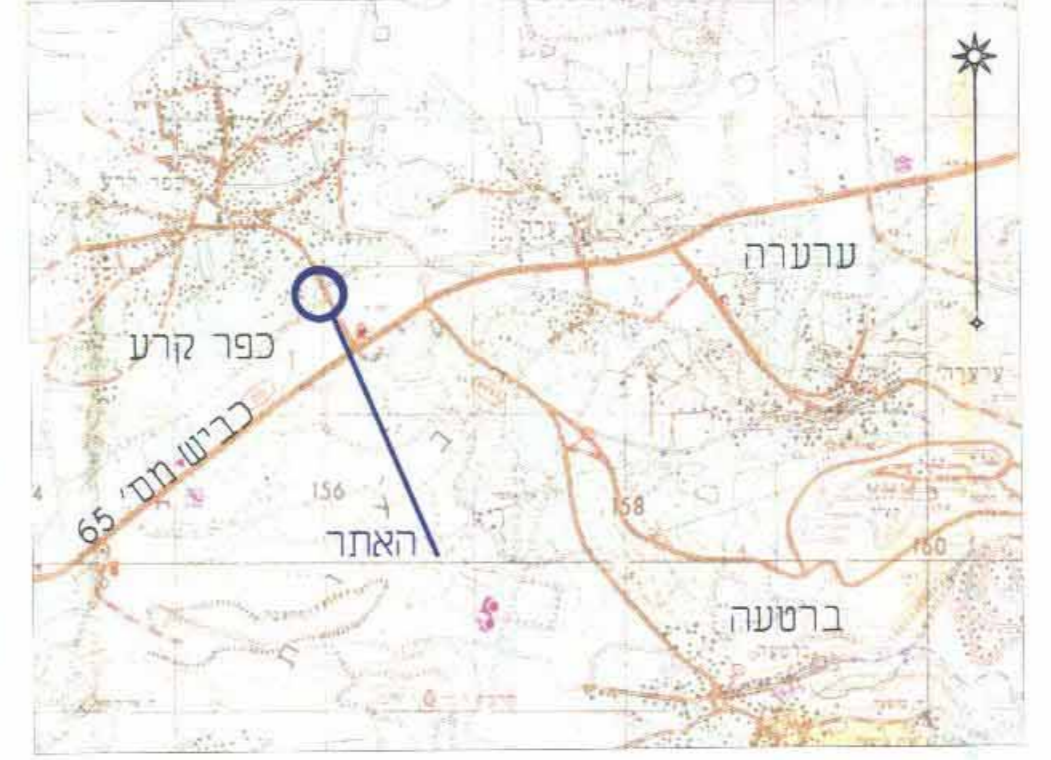
תרשמים האזור קני"מ 1:50000