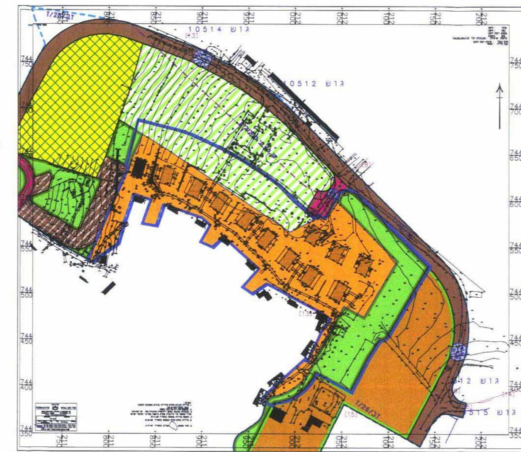
מצב מאושר קנ"מ 1:2500