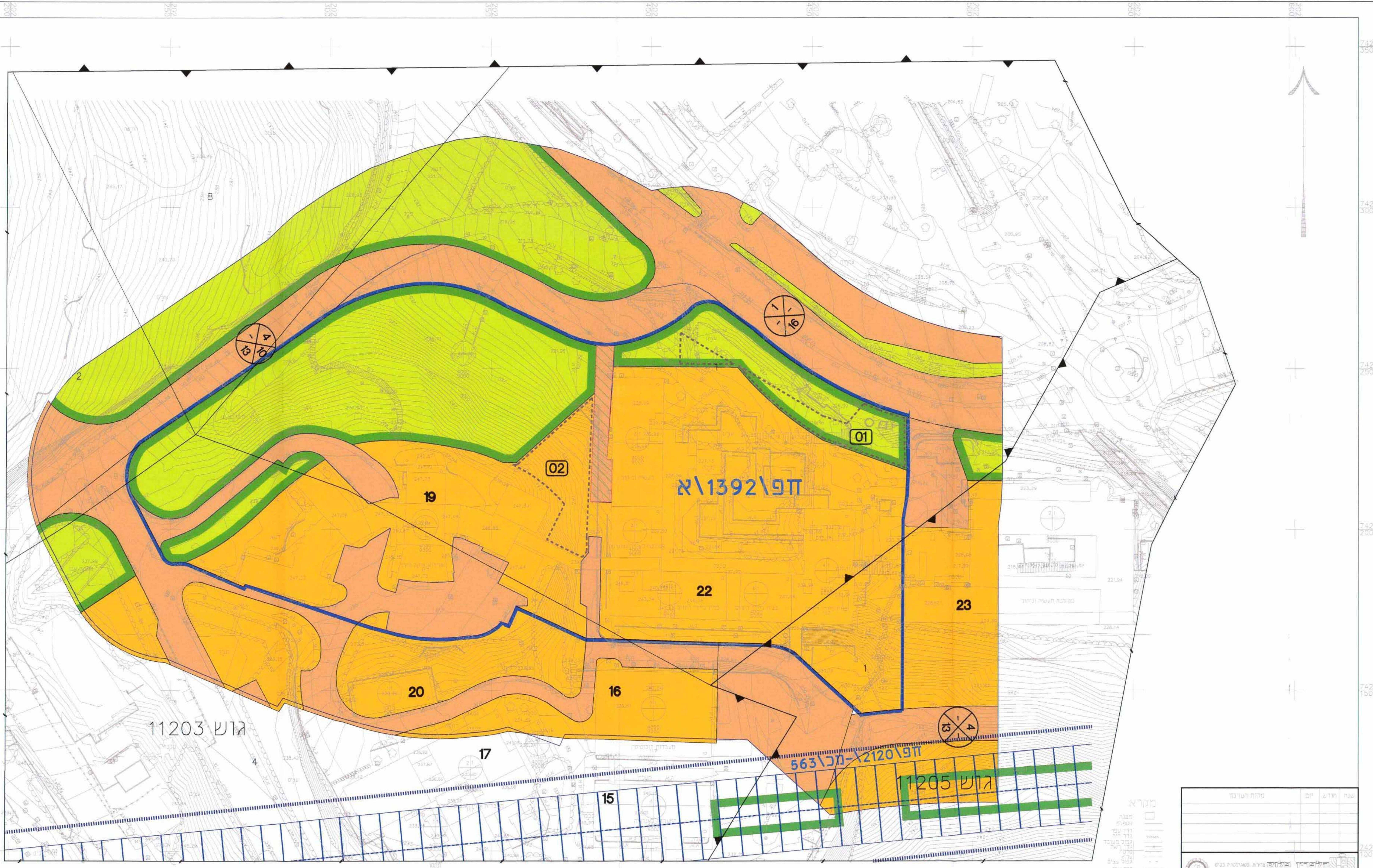
תכנית מצב מאושר קנ"מ 1:500

הערות: המטרה שלעשה הוכנה המפתח והכונן. שטח ביצוע המדידה הכללית פוטוגרמטית שטח ביצוע המדידה האקסטרמית פוטוגרמטית המדידה המשרה לרשת הארצית בנתחיה 13844/13864 1991.3000 המסמך מיוחס למסמך ע"ג גובה הנחוות 40566.806\4897\245.20\4829\55.58 תאריך הרישום 20.06.08