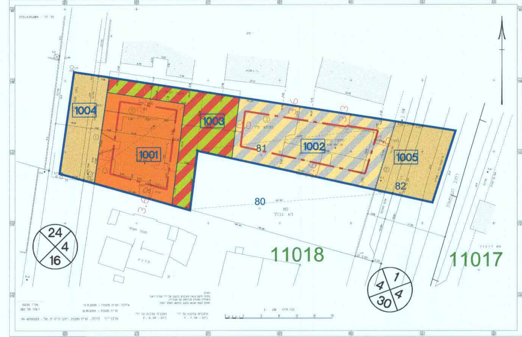
מצב מוצע קנ"מ 1:500