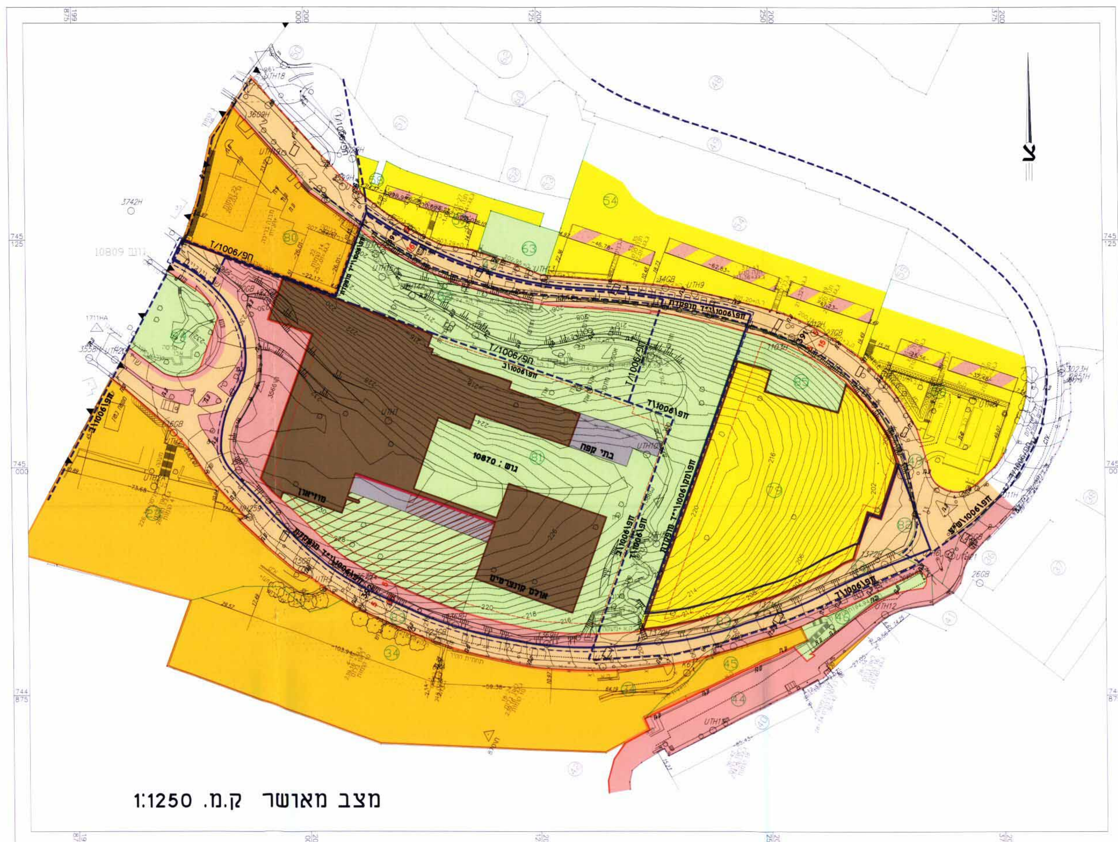
מצב מוצע ק.מ.1:1250