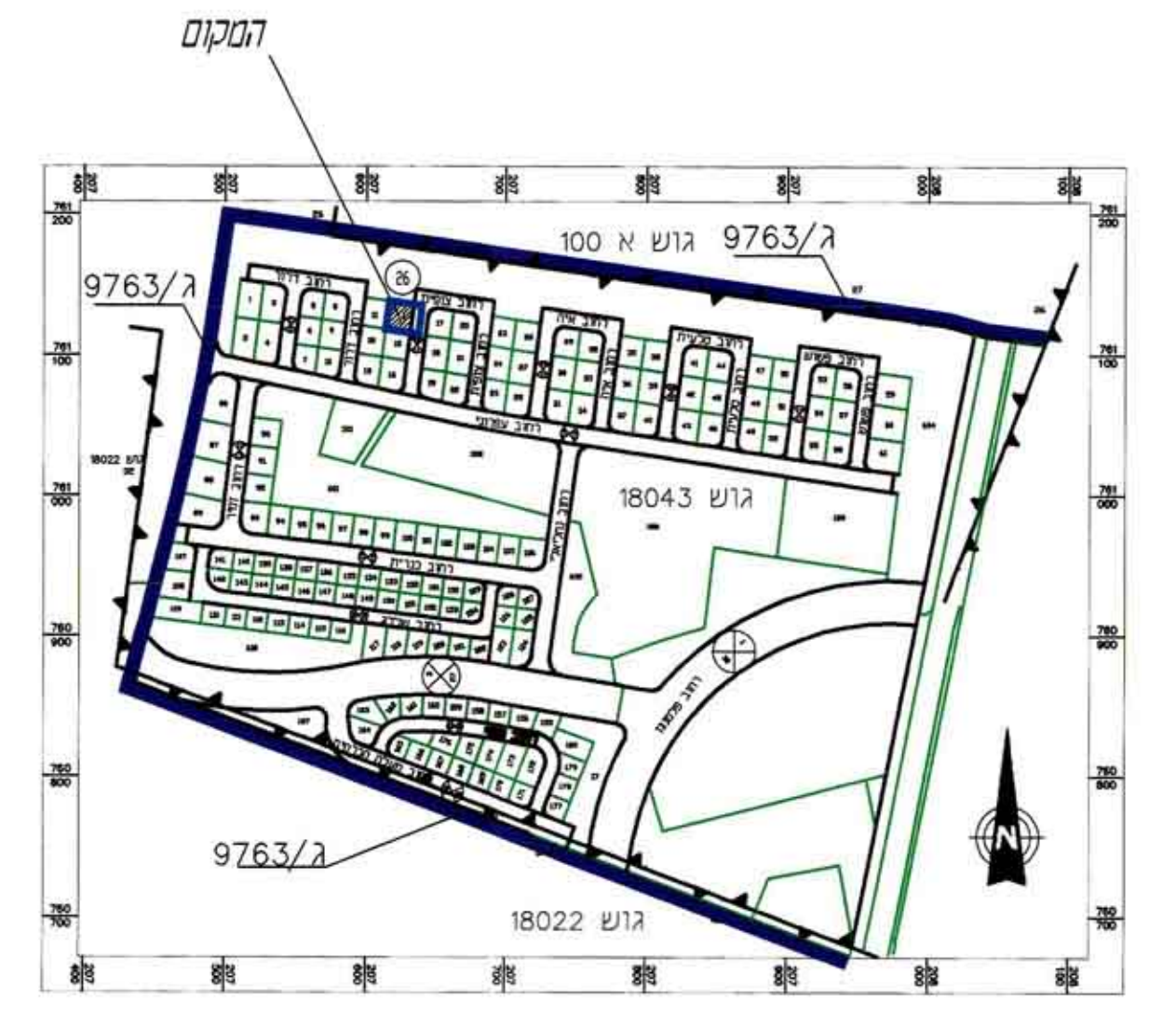
תרשים סביבה קני"מ 1:5000