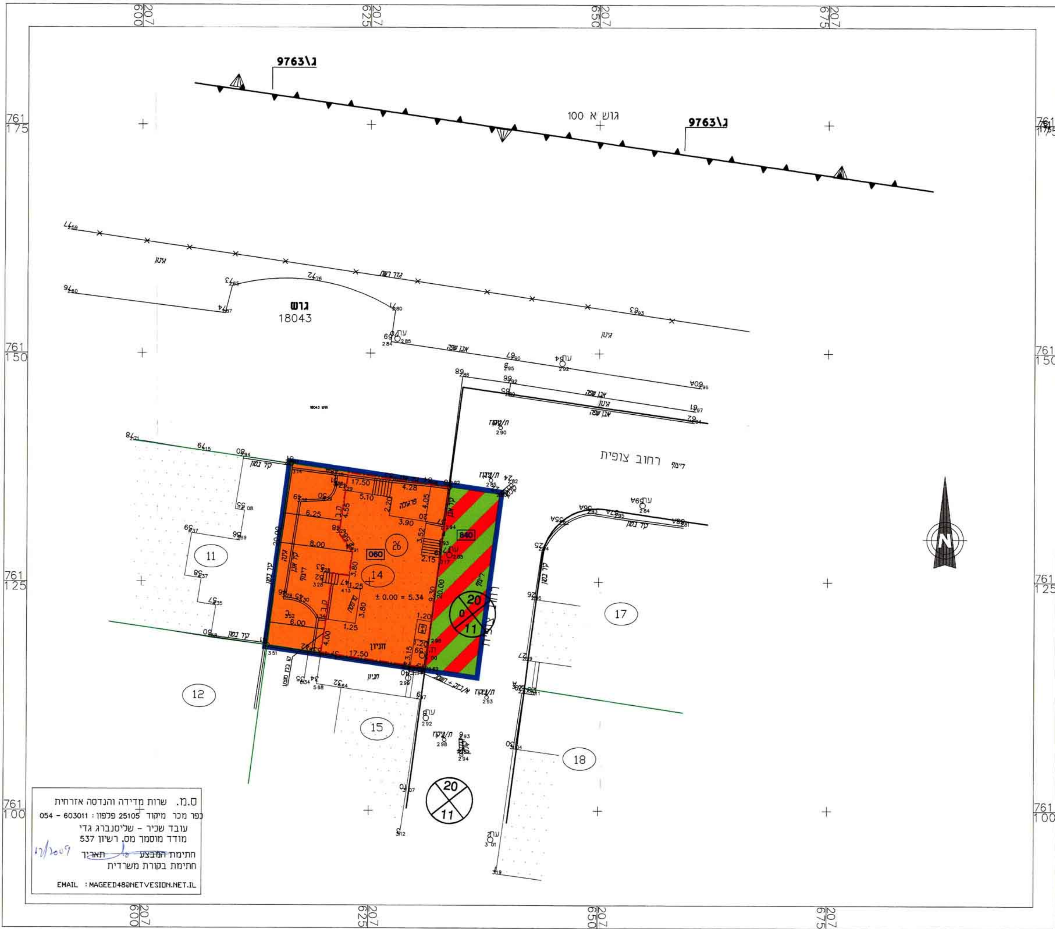
מצב מוצע קני"מ 1:250