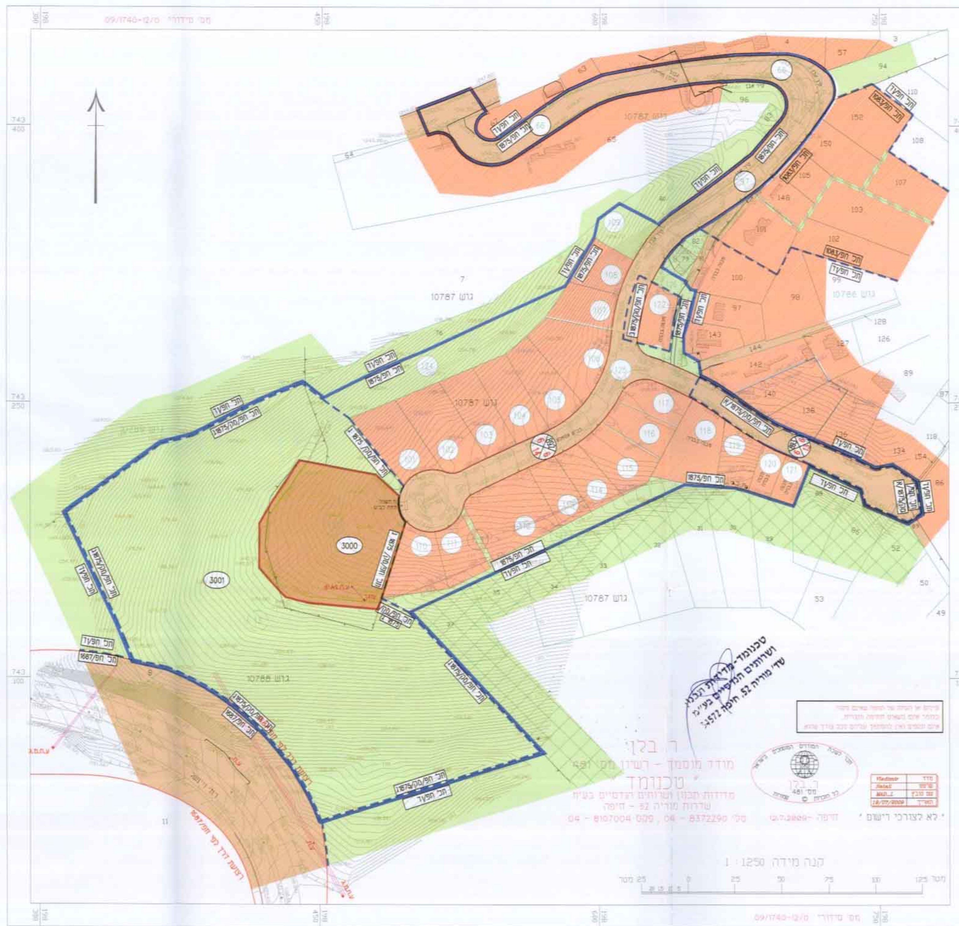
תכנית מצב מאושר ק:מ 1:1250