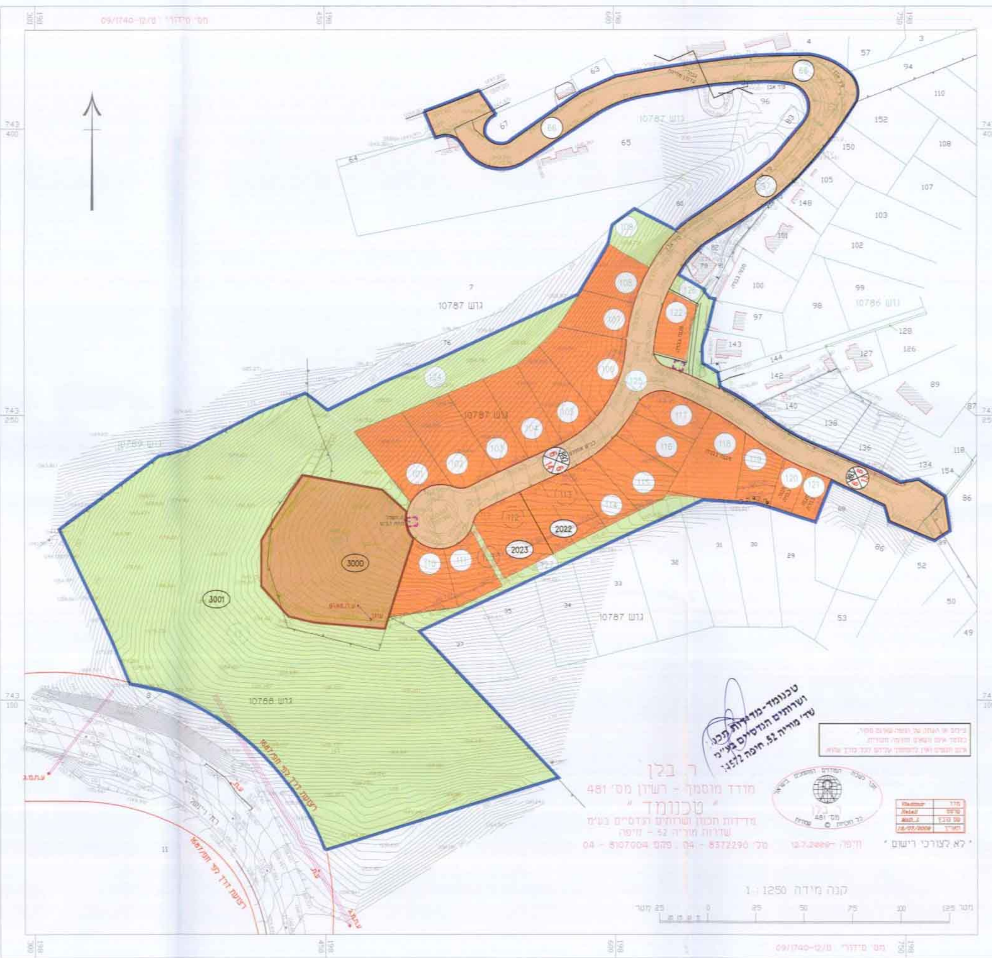
תכנית מצב מוצע ק:מ 1:1250