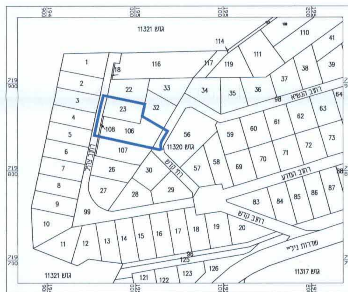
תרשים סביבה קרובה קנ"מ 1:2500