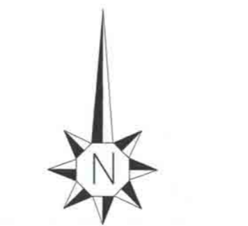
מצב מאושר קניימ 1:500

מספר תכנית: 4317 מספר תוכנית: 2006-2011 תאריך: 10.11.11 מספר תוכנית: 2006-2011 מספר תוכנית: 2006-2011 התוכנית תהיה בתוקף עד לתום תשלום המסות המגיעות לתכנית. במקרה של אי-תשלום המסות תיבוטל התוכנית ותחזור למצבה הקודם. המסות יישלמו לפי הוראות המס הכחול.