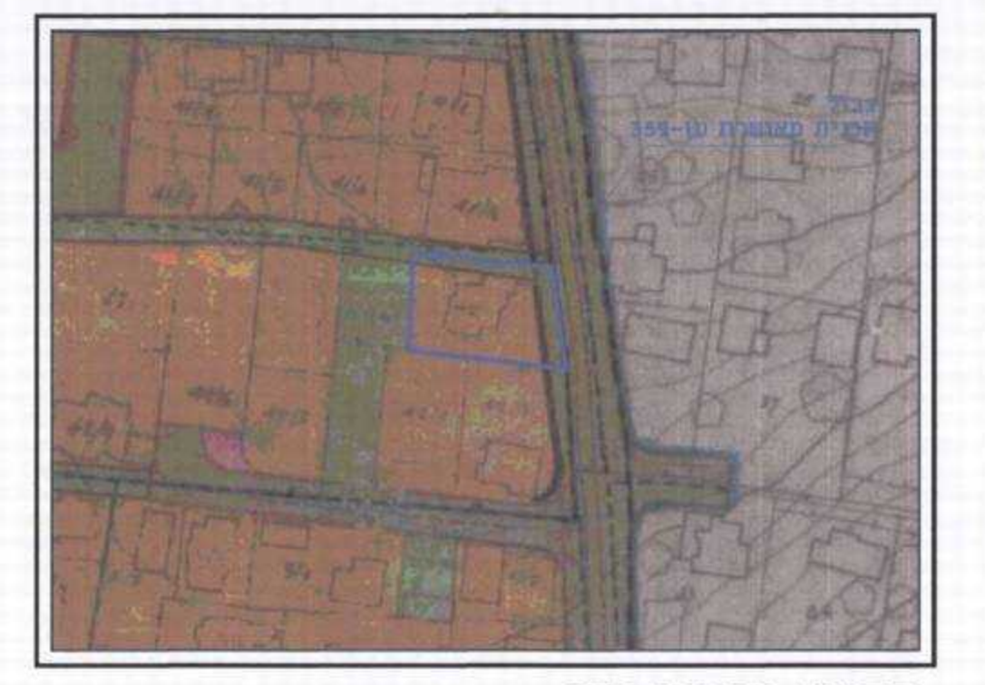
תרשים סביבה לפי תכנית מאושרת