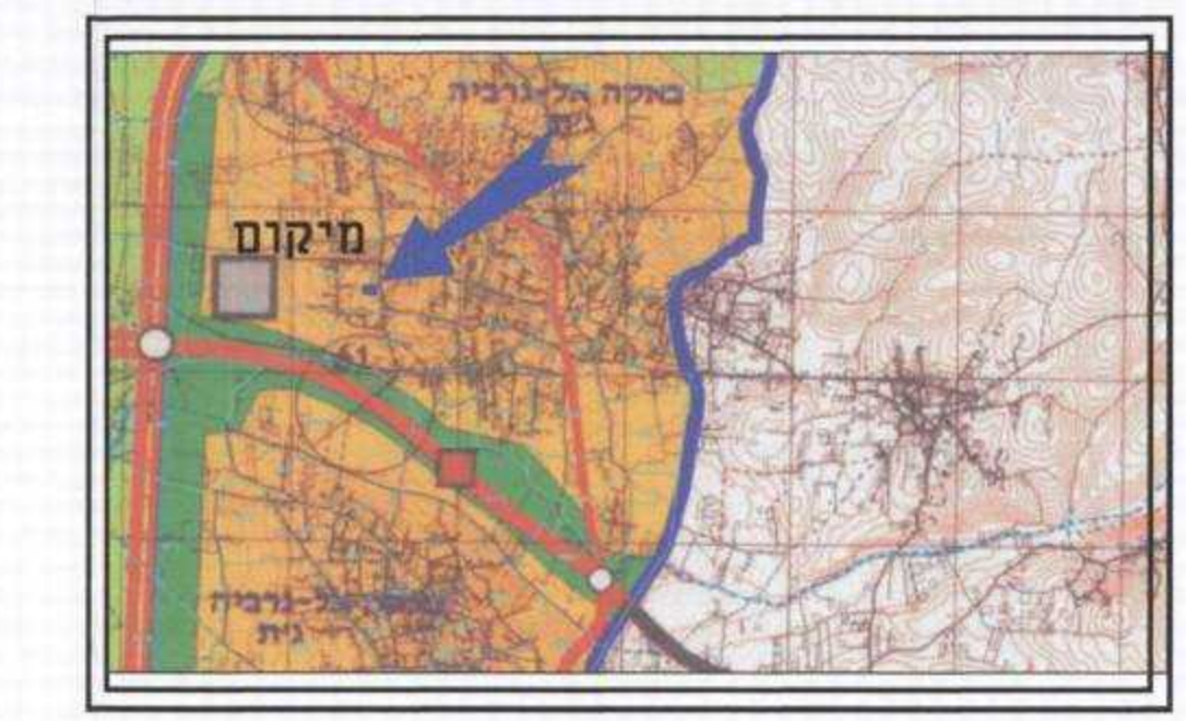
תרשים סביבה לפי תכנית מתאר מחוזית 6-מחוז חיפה

הריני מצרור בזאת כי הרפה המופגרת, המצבית המורה רקע לתכנית זו, הכונה נתיימת על ידי התאריך 10/07/2012 וכי כל רפרטים שבמפה הם מדויקים ודיא רוכנה ברוחם לדראותחוקק ולתקנות ועני להצורר כי המדידה בוצעה לפי תנאי התכנון והפגלים לא קיימים עטים בוגרים עמאר כי ביאסי מסמך מספר רשון 10/07/2012