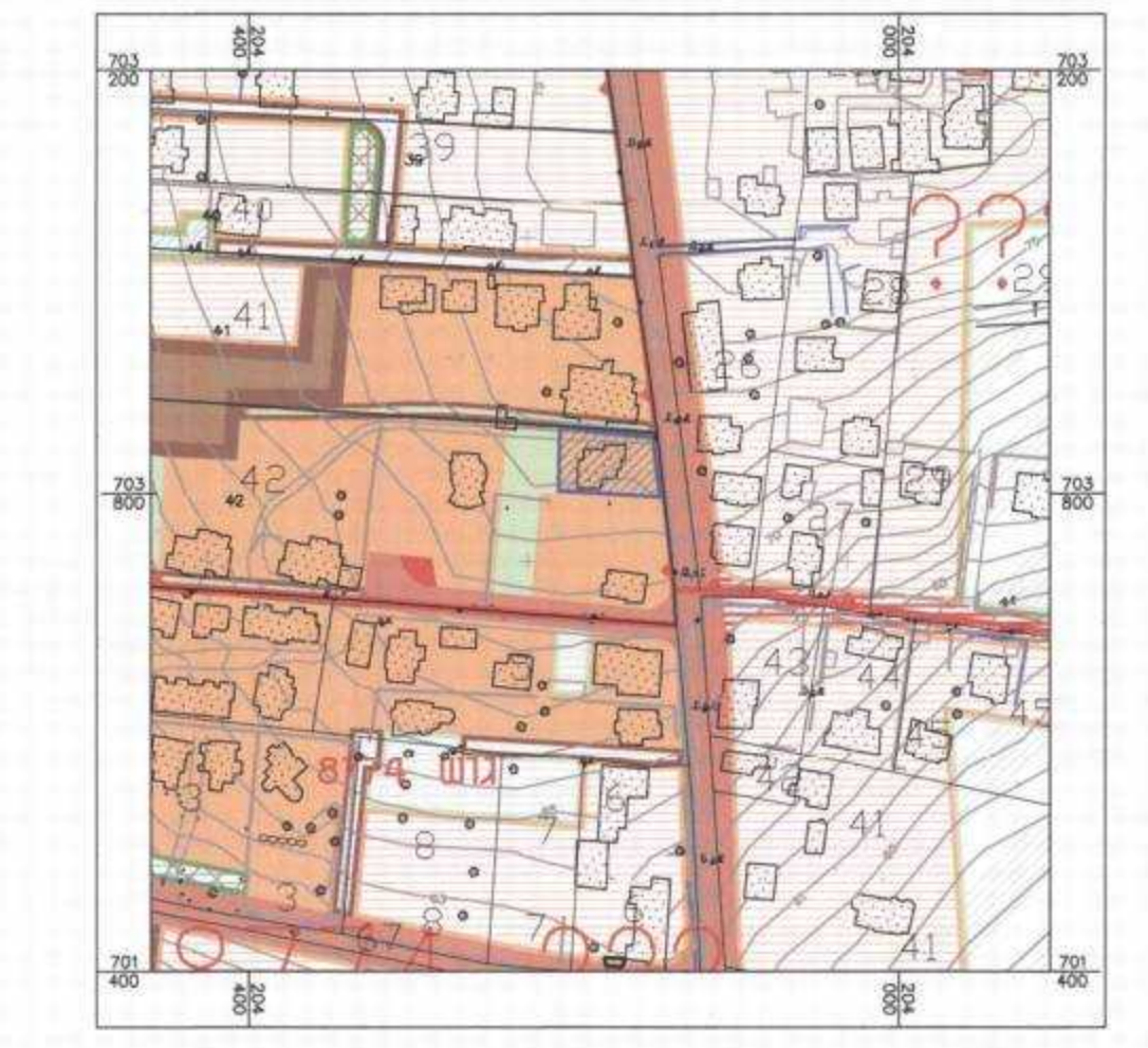
תרשים סביבה קנ"מ 1:2500