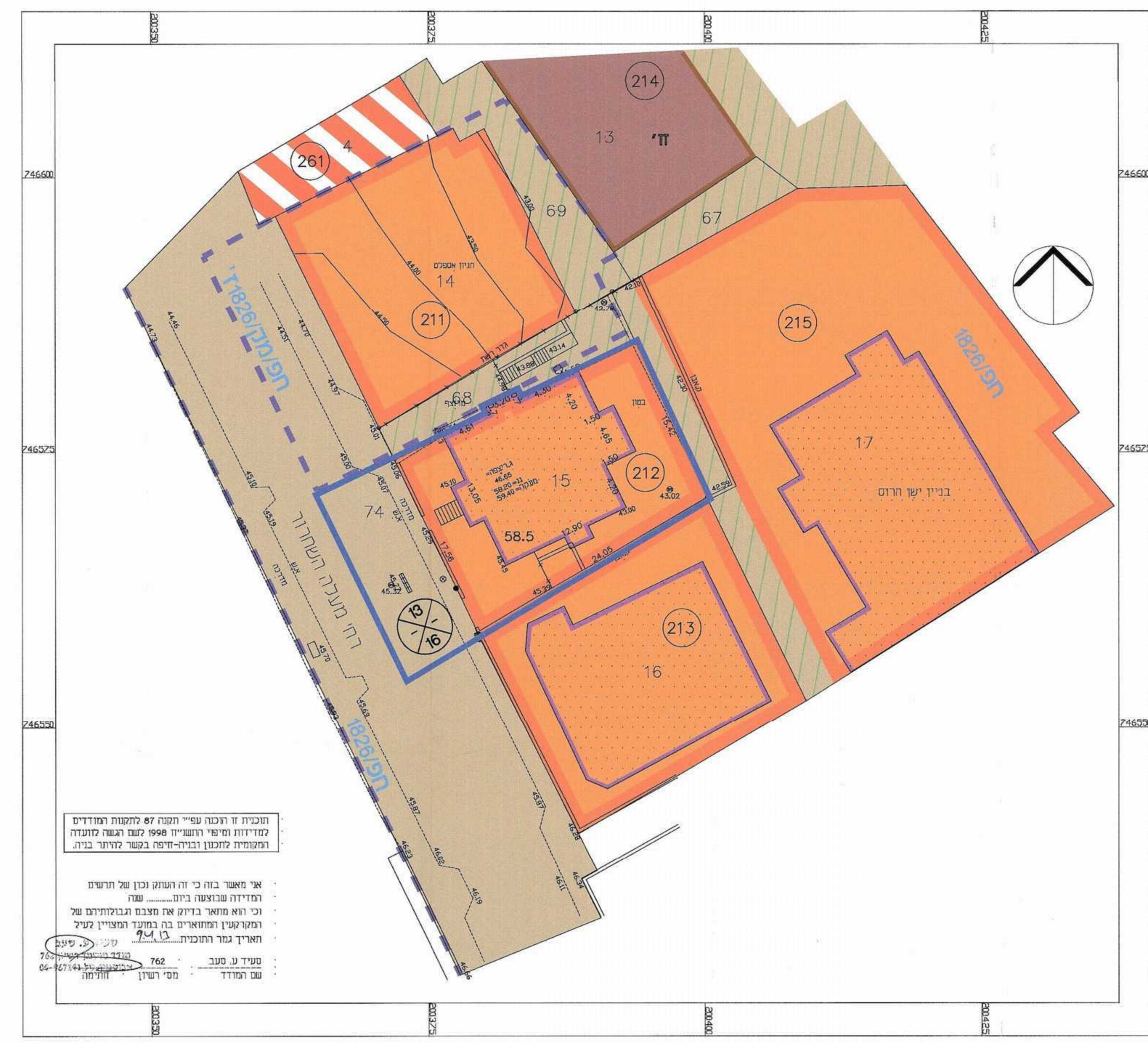
מצב מאושר קנייני 1:250

תוכנית זו הוכנה ע"י המנהל 87 לחקטת המודדים למדידות ומיפוי רחביי 1998 לשם הגדרת חוקתה ומסמית חוקתה ובדיקה-היפה בפשר לדו"ח בית אי מאשר בהו כי זה העתק נכון של תרשים המדידה שנבוצעה ביום... שנה וכי הוא מואר בדיוק את המצב והגבולות של המגרש ומתארים בה המדידות המצויין לעיל והאריך גמר התוכנית 29.5.2013 טעיר ע. טעב 762 מס' רישון 04-9967141