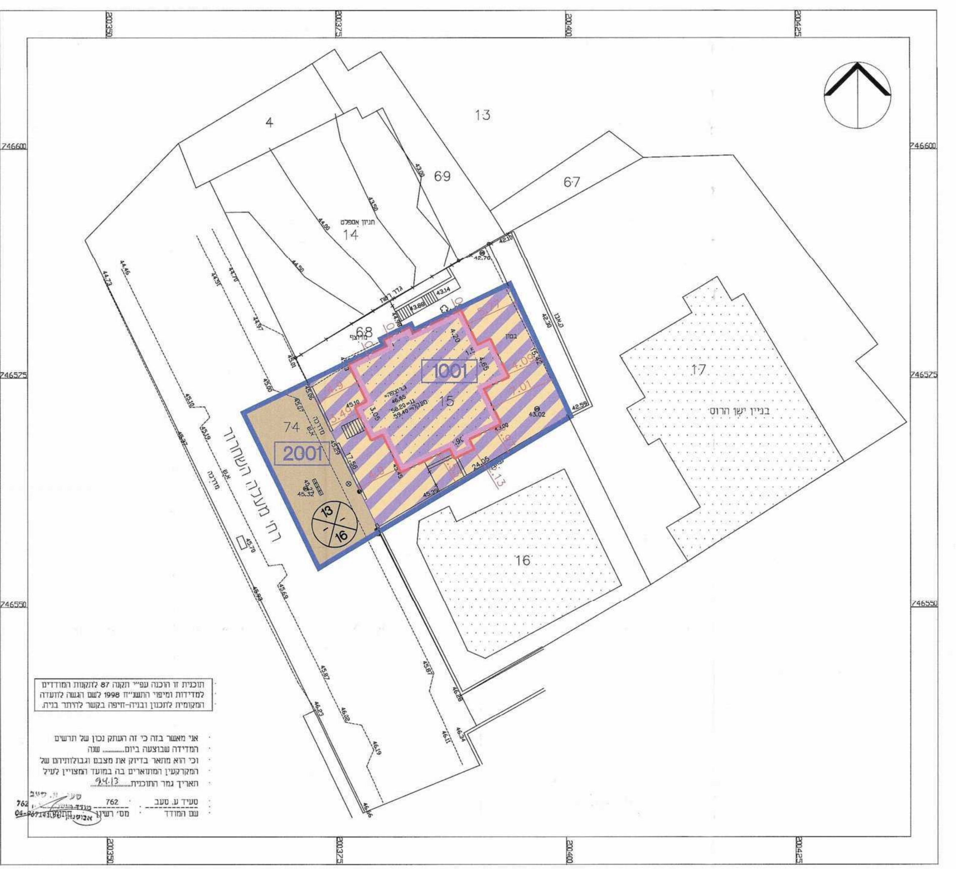
מצב מוצע קנייני 1:250

תוכנית זו הוכנה ע"י המנהל 87 לחקטת המודדים למדידות ומיפוי רחביי 1998 לשם הגדרת חוקתה ומסמית חוקתה ובדיקה-היפה בפשר לדו"ח בית אי מאשר בהו כי זה העתק נכון של תרשים המדידה שנבוצעה ביום... שנה וכי הוא מואר בדיוק את המצב והגבולות של המגרש ומתארים בה המדידות המצויין לעיל והאריך גמר התוכנית 29.5.2013 טעיר ע. טעב 762 מס' רישון 04-9967141