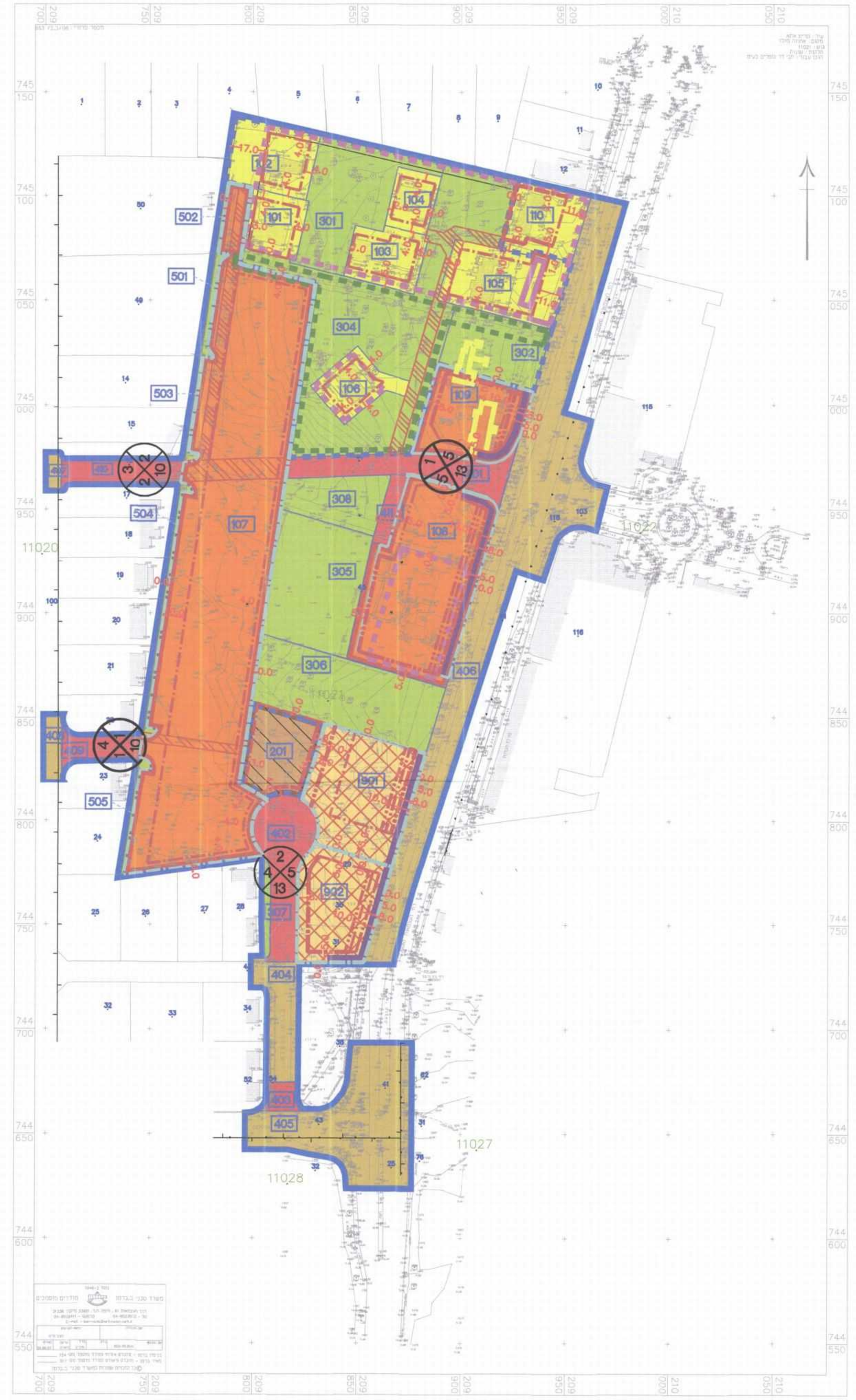
מב מוצע קנ"מ 1:1250