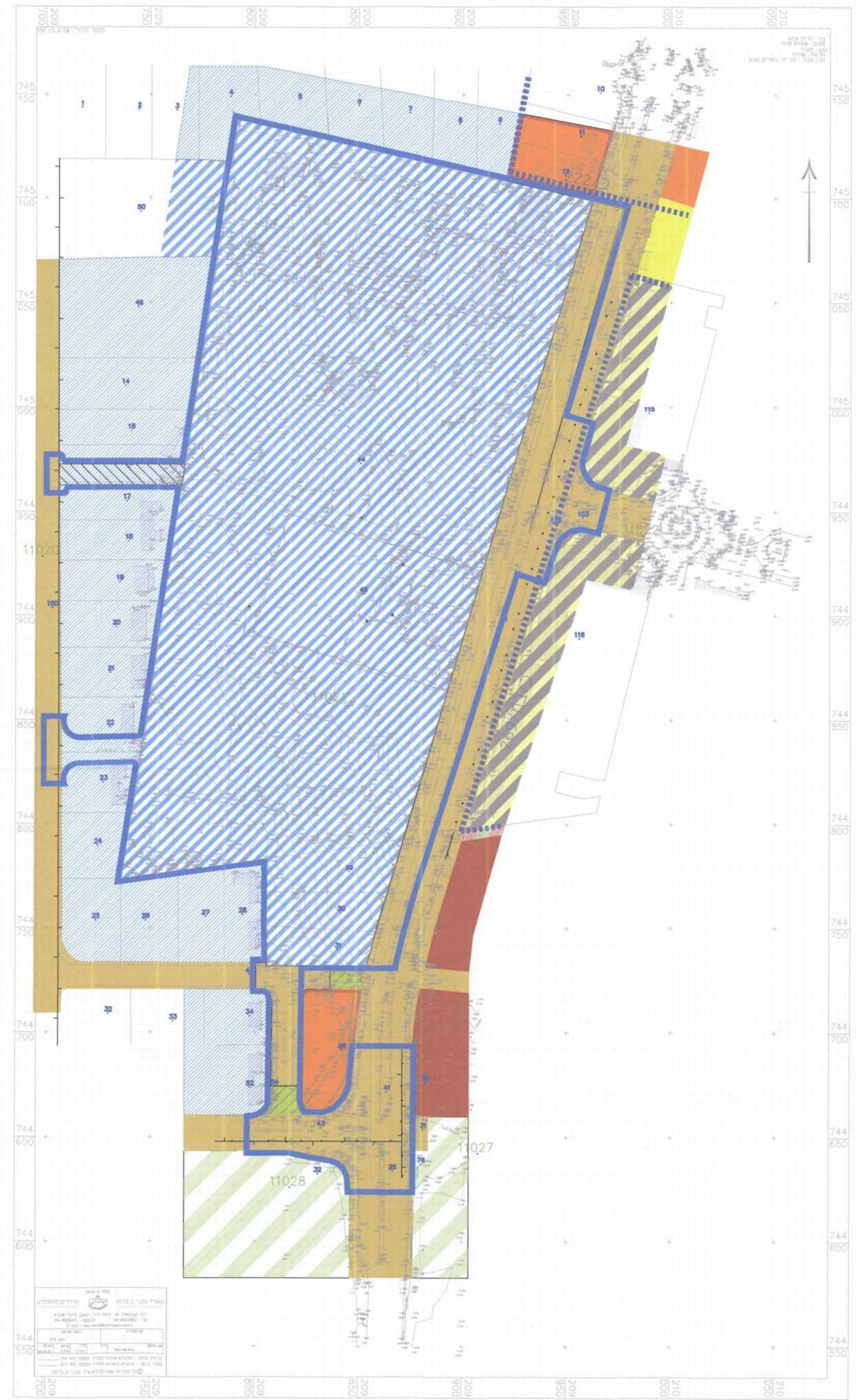
מב מאושר קנ"מ 1:250