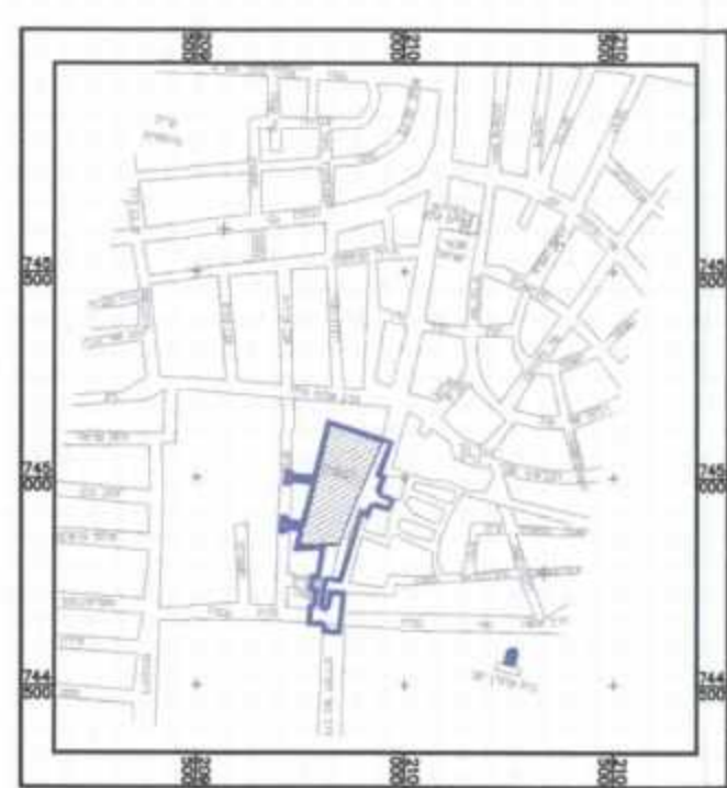
תרשים סביבה קנ"מ 120,000