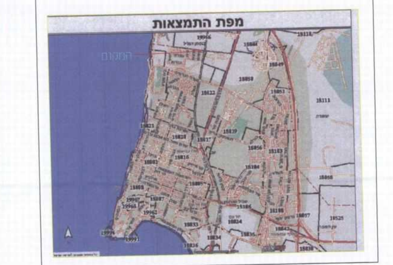
מפת התמצאות בלתי - ק"מ 1:20,000