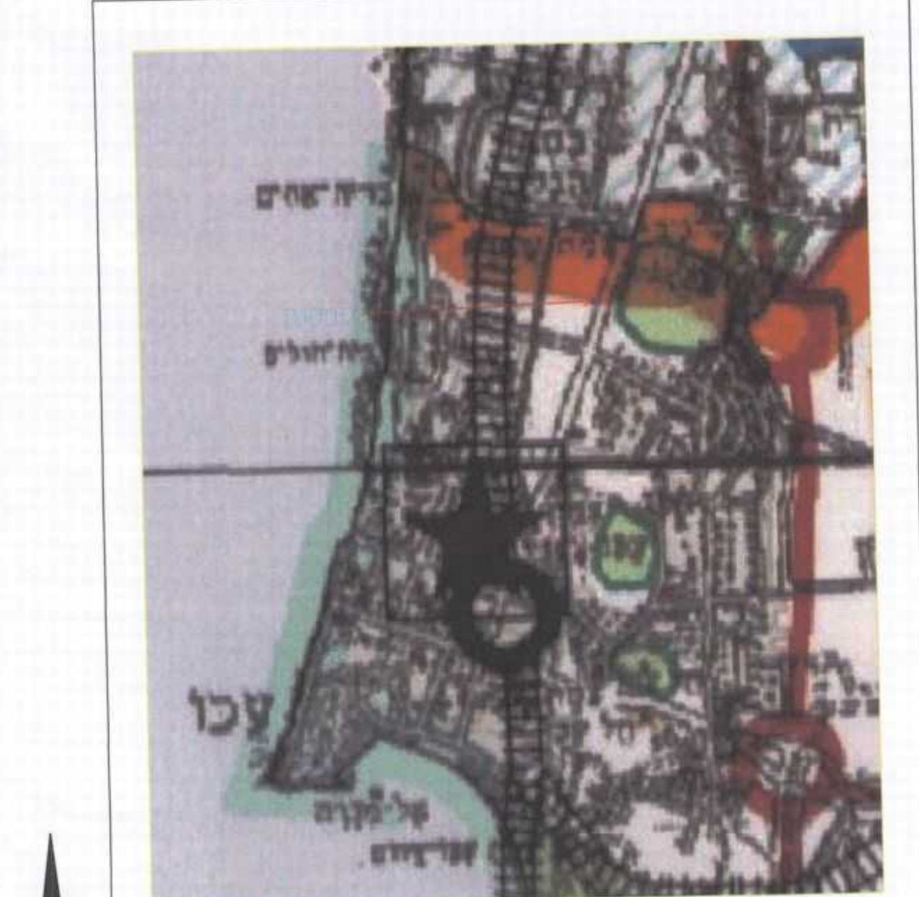
המ"ר א-35 החייה סביבה