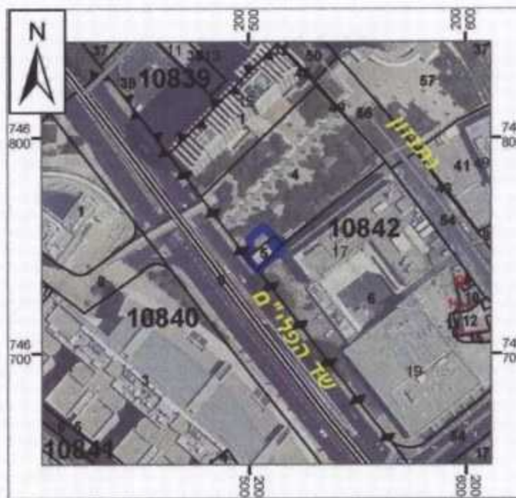
תרשים סביבה קנ"מ 1:2,500