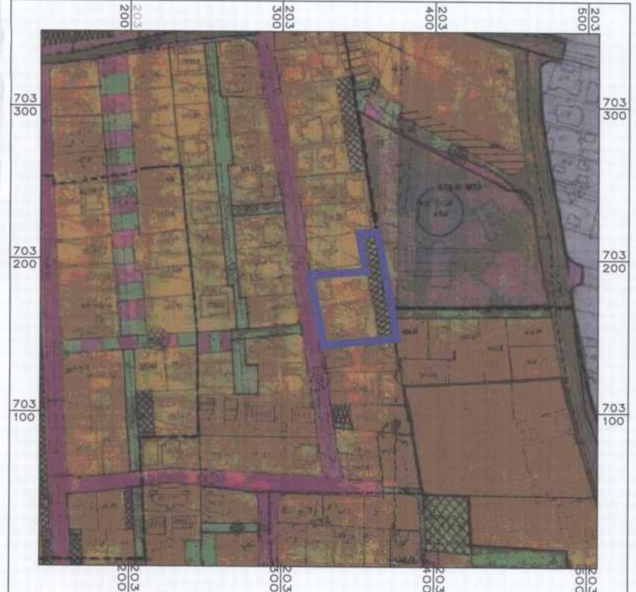
מצב מאושר לפי תכנית קנ"מ 1:2500