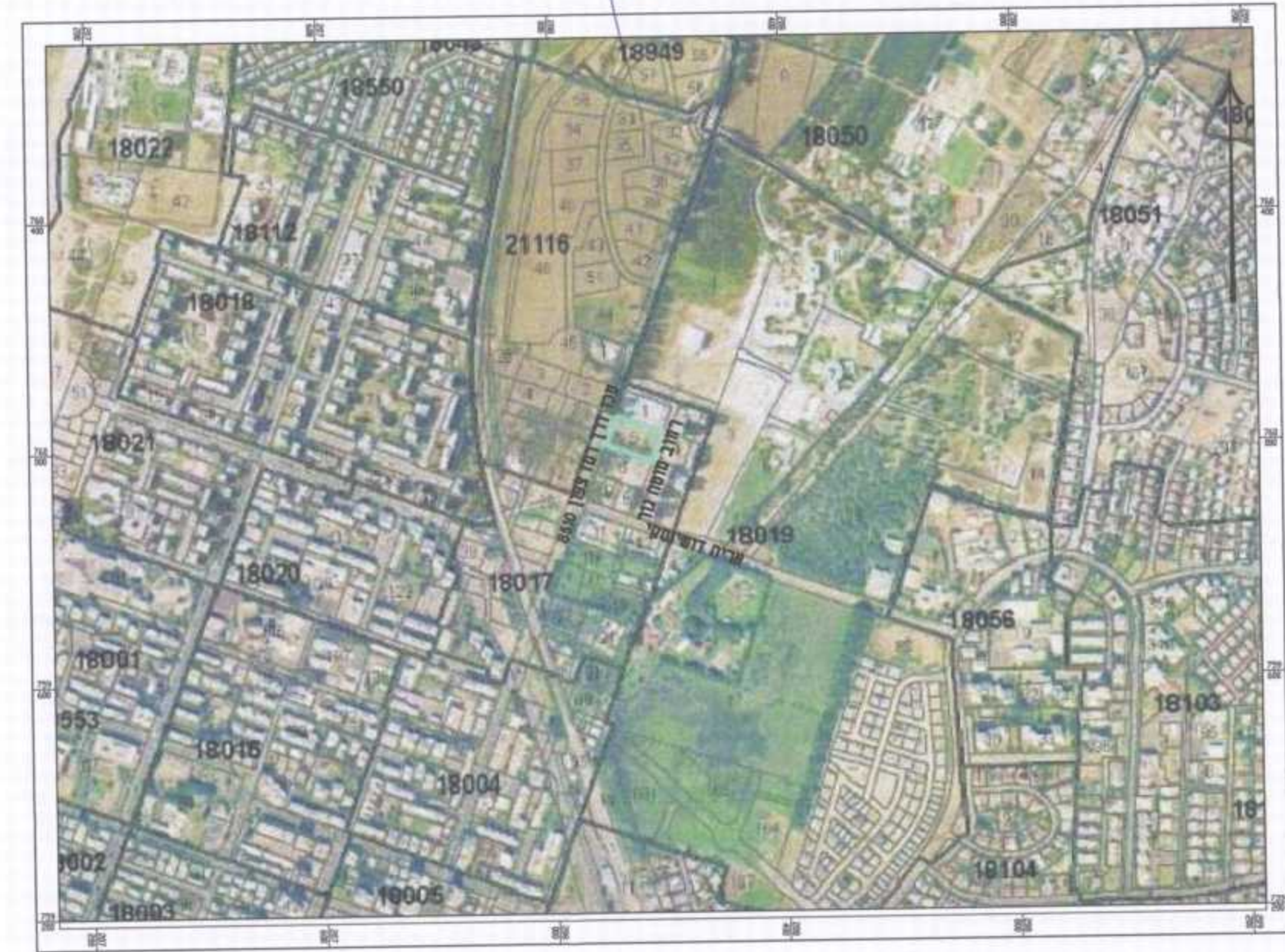
תרשים סביבה קנ"מ 1:10000

הודעה על אישור תכנית מס' 213-0225672 מספרם בילקום הרשמיים של מיום