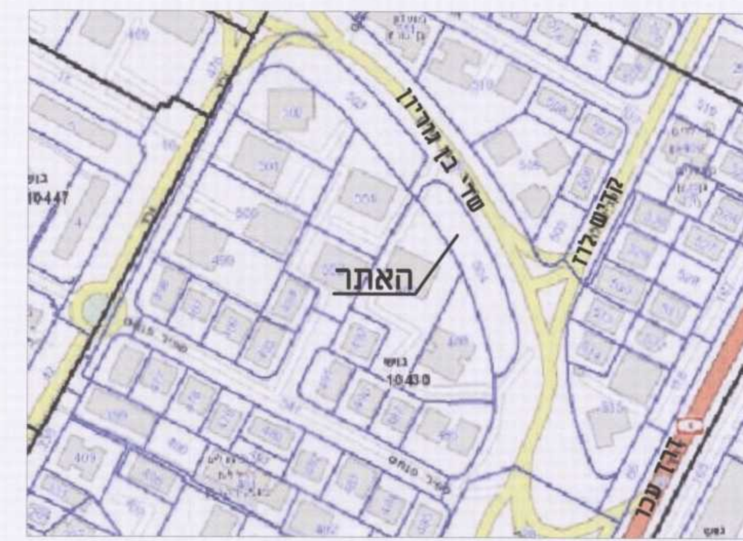
תרשים סביבה קנ"מ 1:2,000