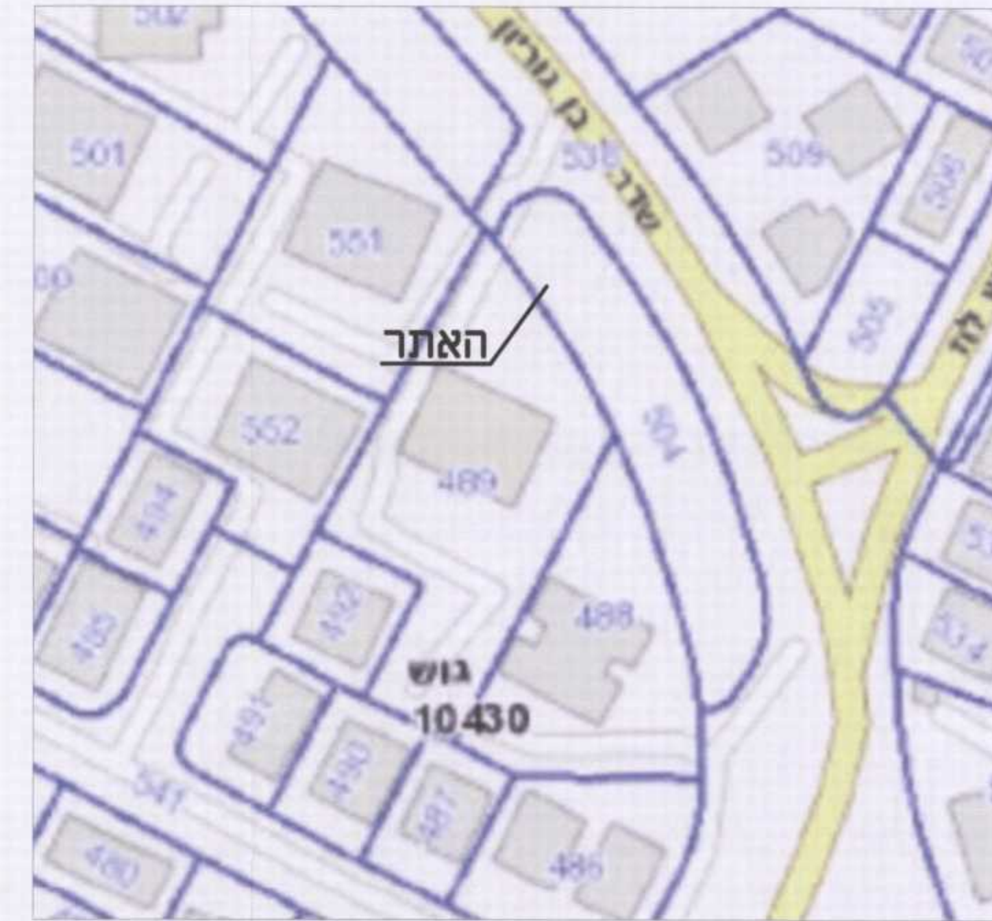
תרשים סביבה קנ"מ 1:1,000