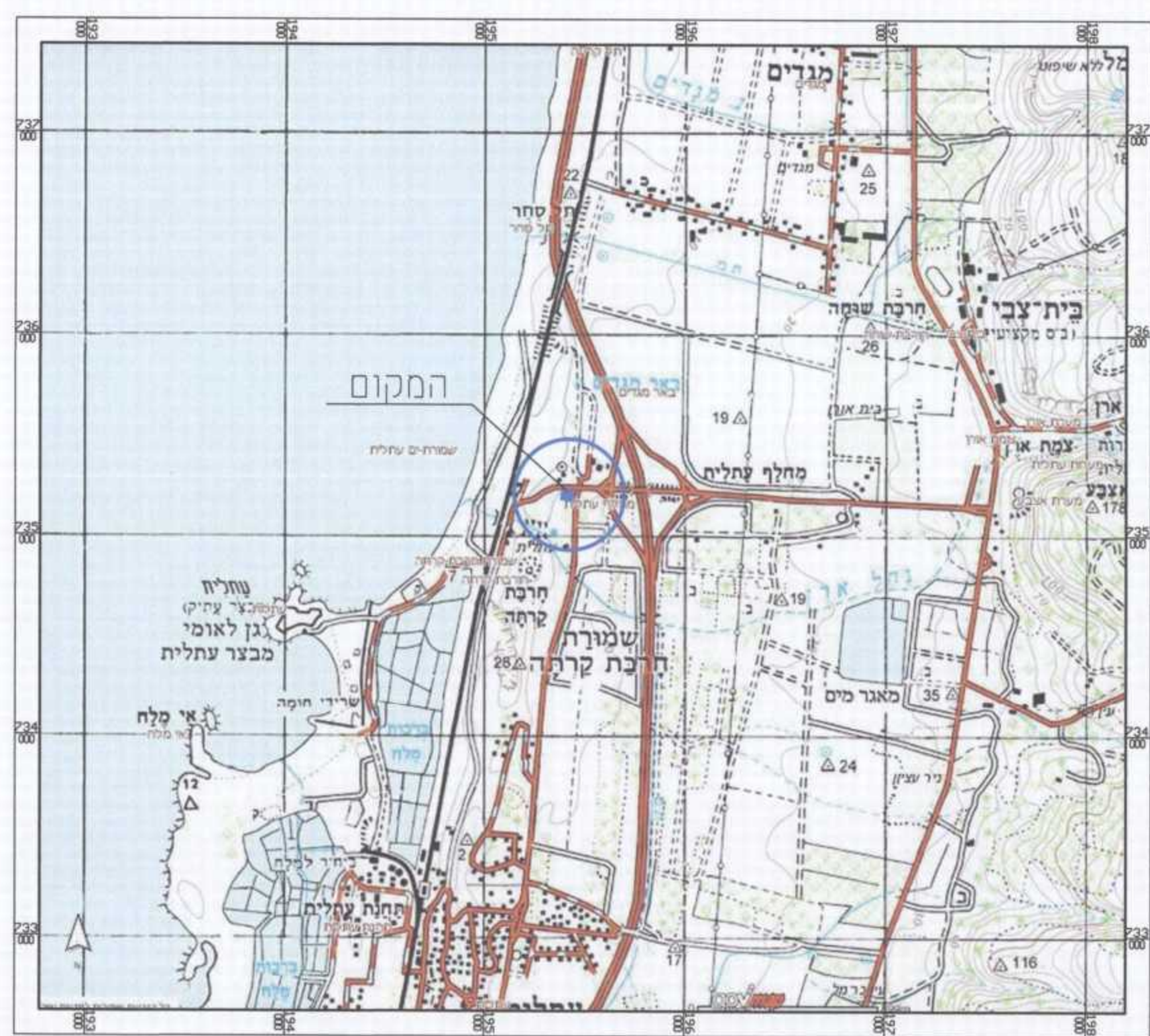
תרשימים התמצאות קנ"מ 1:25,000