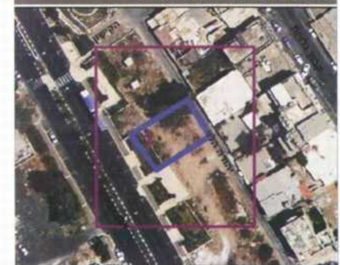
שנת צילום אוויר: 2012/2013