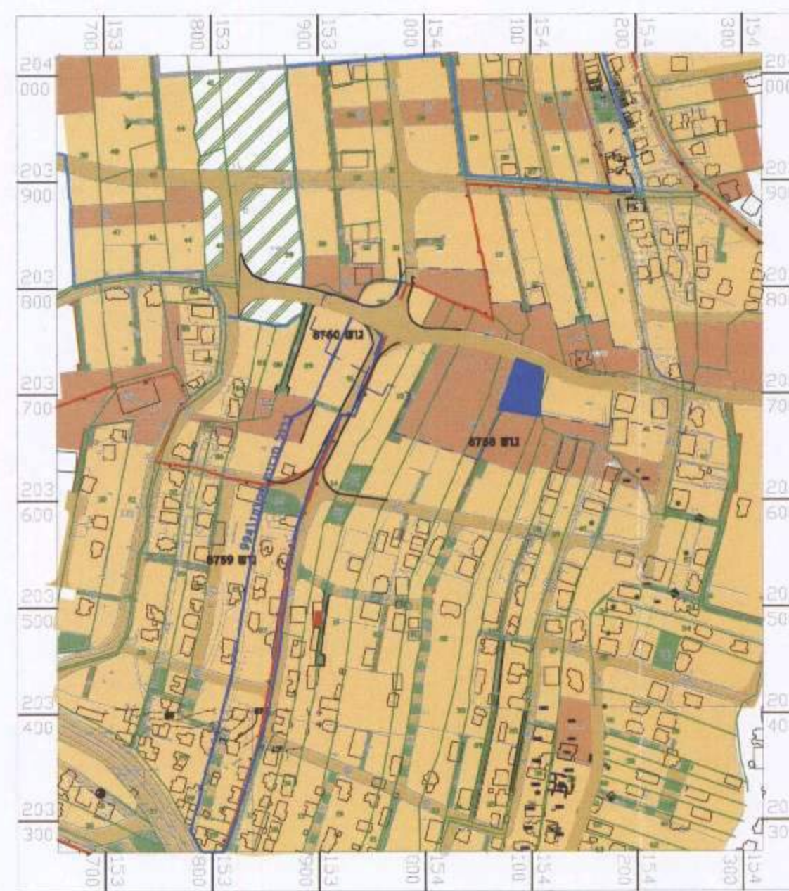
מצב מאושר קנ"מ 1 : 5000

מינהל התכנון - מחוז חיפה הועדה המחוזית והבנייה, תשס"ו - 1965 הועדה המחוזית להליטה ביום: 9.11.16 לאשר את התכנית 5.117 תאריך: 2/11/16