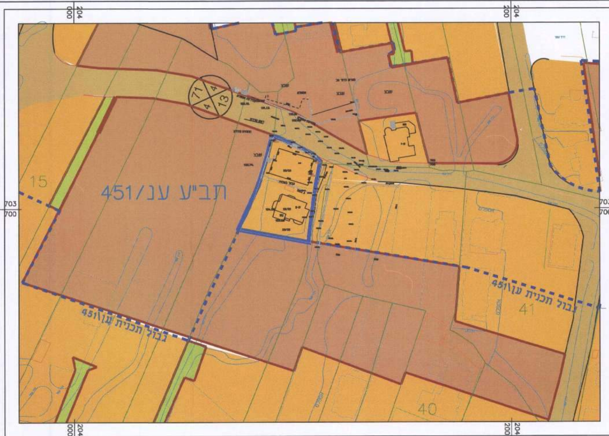
מצב מאושר קנ"מ 1 : 1000

הגדלת אחוזי בניה בתא מספר 10 בחלקה 22 בגוש 8758 בבאקה