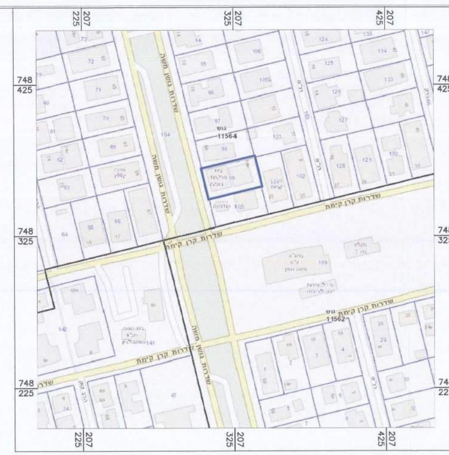
תרשים התמצאות 1:1500

הריני מצוין באות כי מדידת המפה והמושגות/המצבית המרוחה רקע לתוכנית זו, וערכה על ידי ביום: _____ והיא רוכנה לפי הוראות נוהל מבאת ובהוצאה לרואת החוק ולחוקת המודדים שבעתקף, דיוק הוא הכוזל והקדסטר, מדידה / קו כוזל (בלבד) ברמה אנליטית/ מדידה אנליטית מלאה ברמת חצי (מכלל הוא הכוזל) חובב איהאב מ.ר. 726 עס המודד מספר רשיון חתימה תאריך