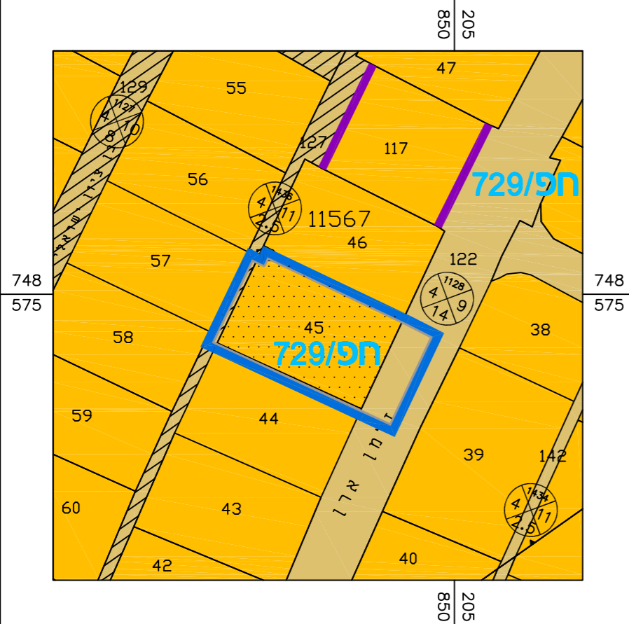
מ.ק.ר.א. מ.צ.ב. מ.א.ו.ש.ר