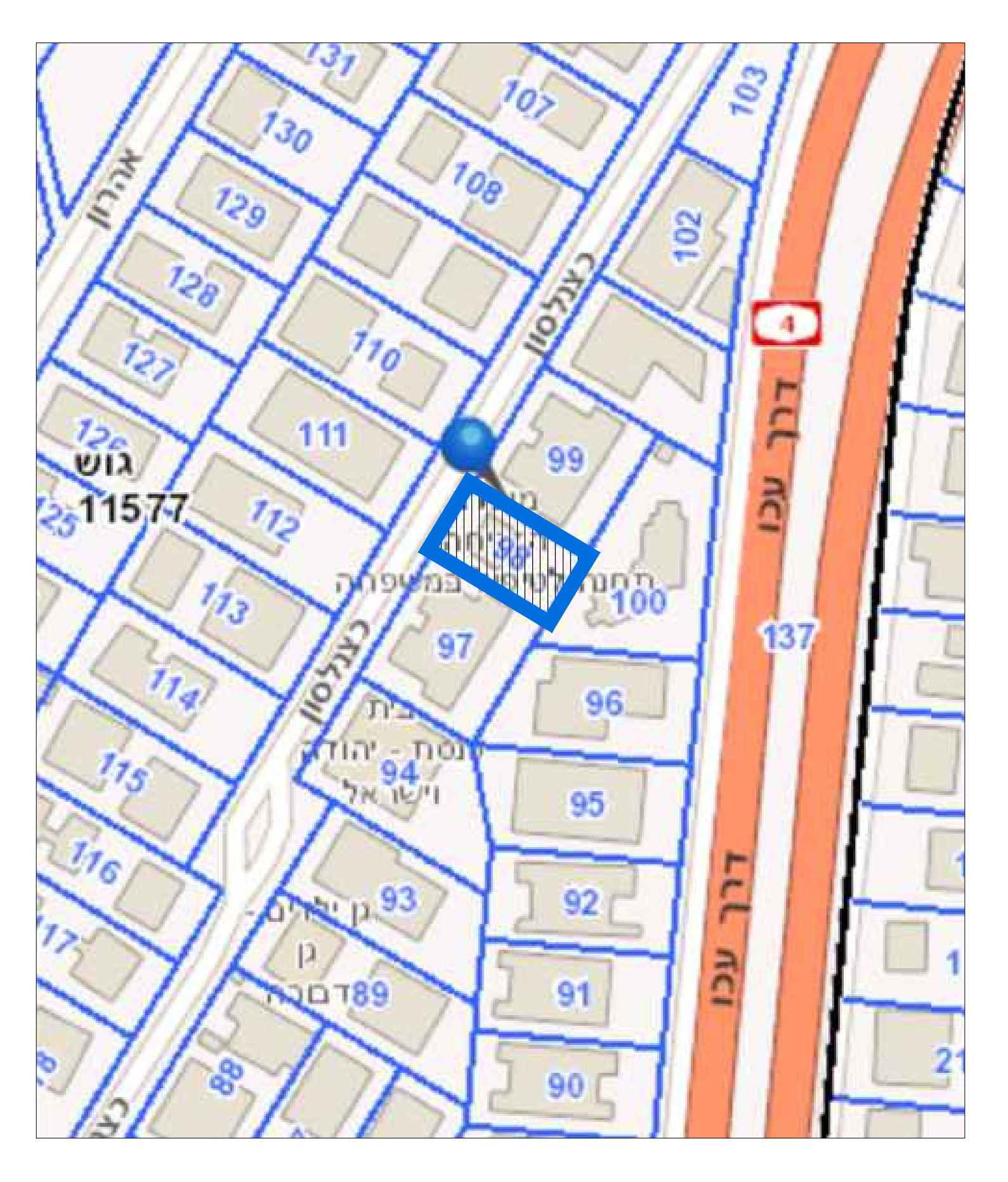
תרשים סביבה קנ"מ 1:1000