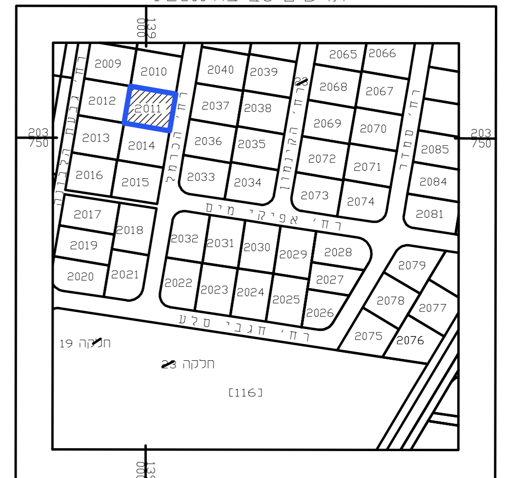
תרשים סביבה 1:2500