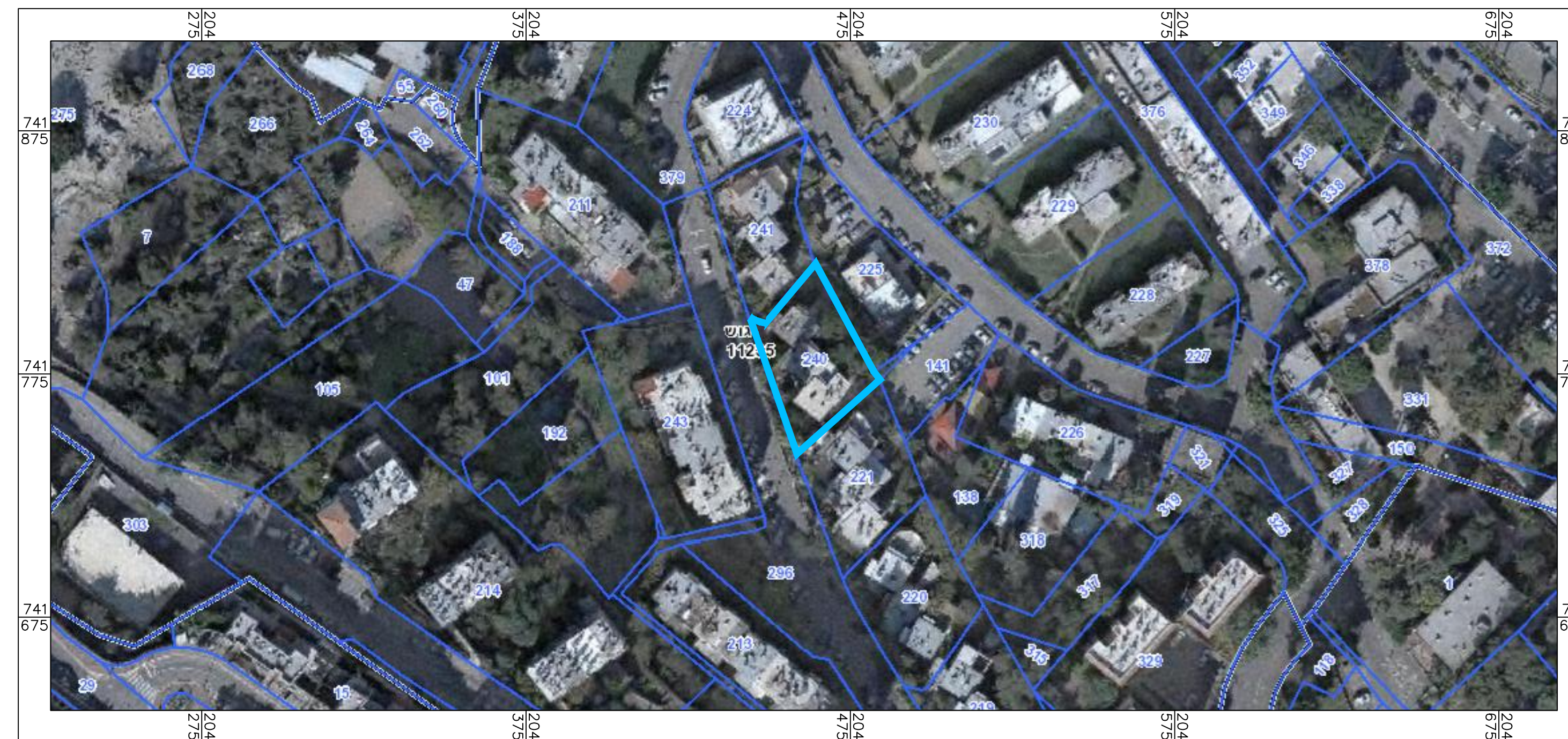
תרשים סביבה קרובה - אורתופוטו קנ"מ 1:1000

חוק התכנון והבנייה, התשכ"ה - 1965 תכנית מתאר מקומית