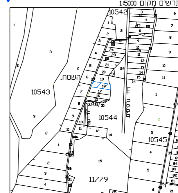
מצב מאושר 1:500