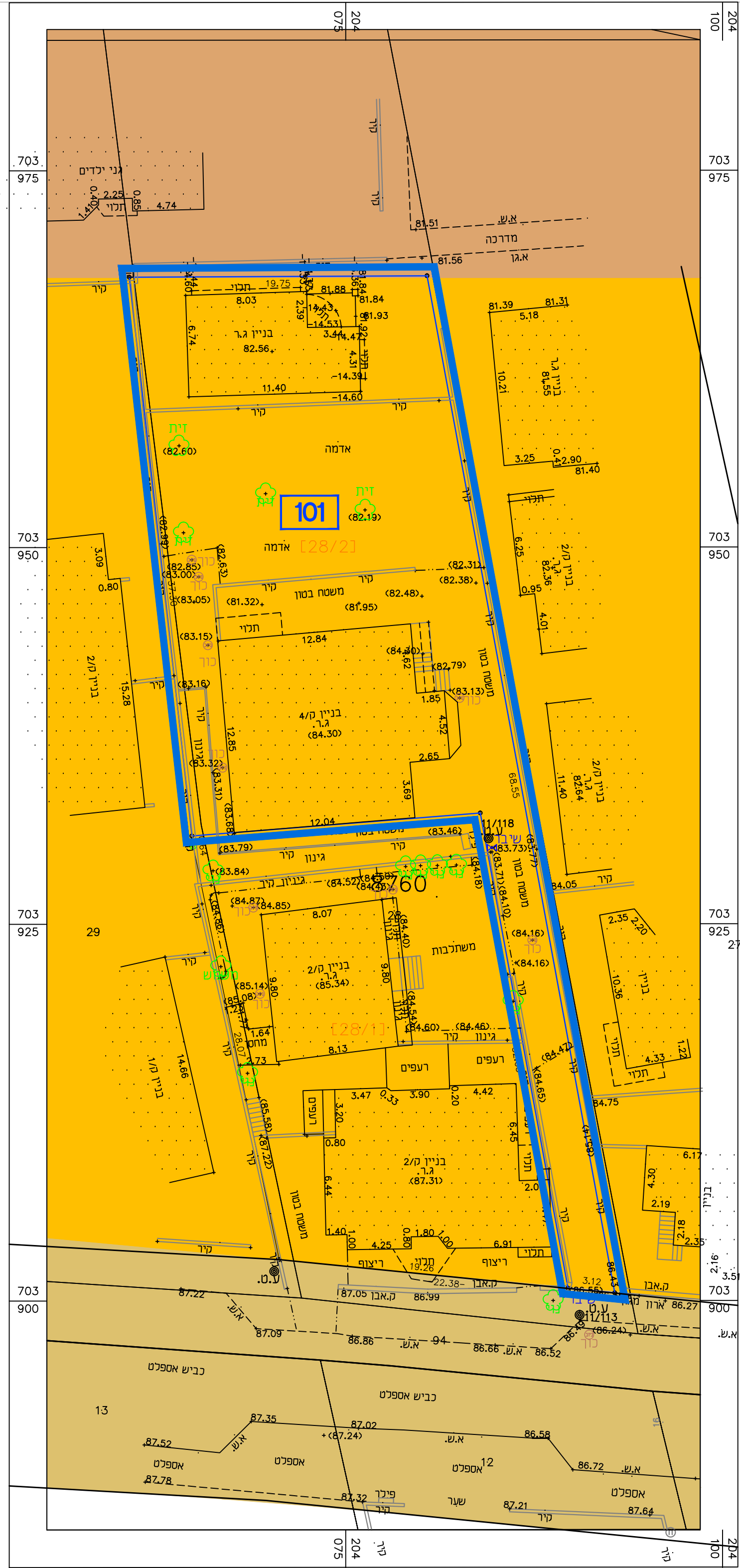
מצב מאושר קני"מ 1 : 250 (ע"פ תכנית ע"במ\358)